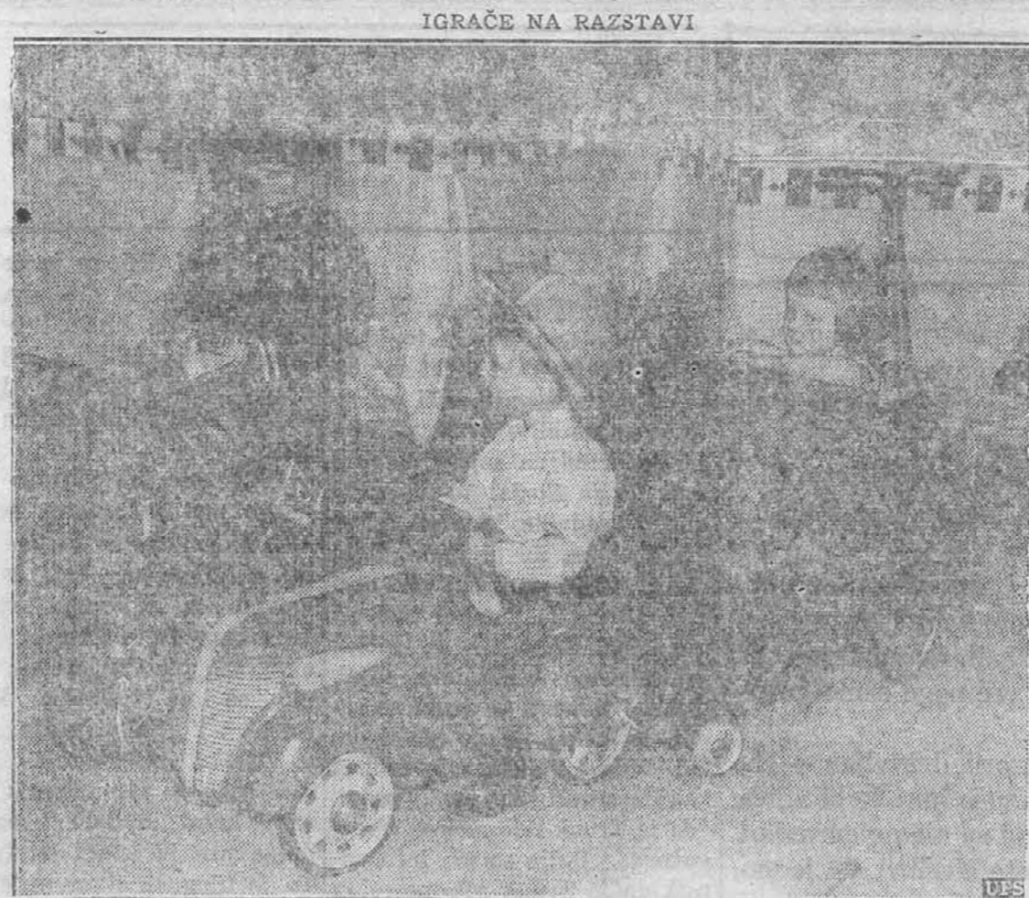
V New Yorku so tovarne za izdelovanje otroških igrar pridobile posebno razstavo svojih produktov, kjer je bila vzeta tudi gornja slika, ki kaže vozilo, izdelano v modernem stilu.

Madrid, Španija. — Zadnje nedeljo se je v tem mestu proslavljala obletnica, odkar se ustavlja napadom nacionalistov. Po naključju je isti dan sovjetska Rusija praznovala 20 letnico boljševskega režima in španska vlada je poslala čestitke v Moskvo ter je istočasno prekrstila neko ulico v "Cesto sovjetske unije."