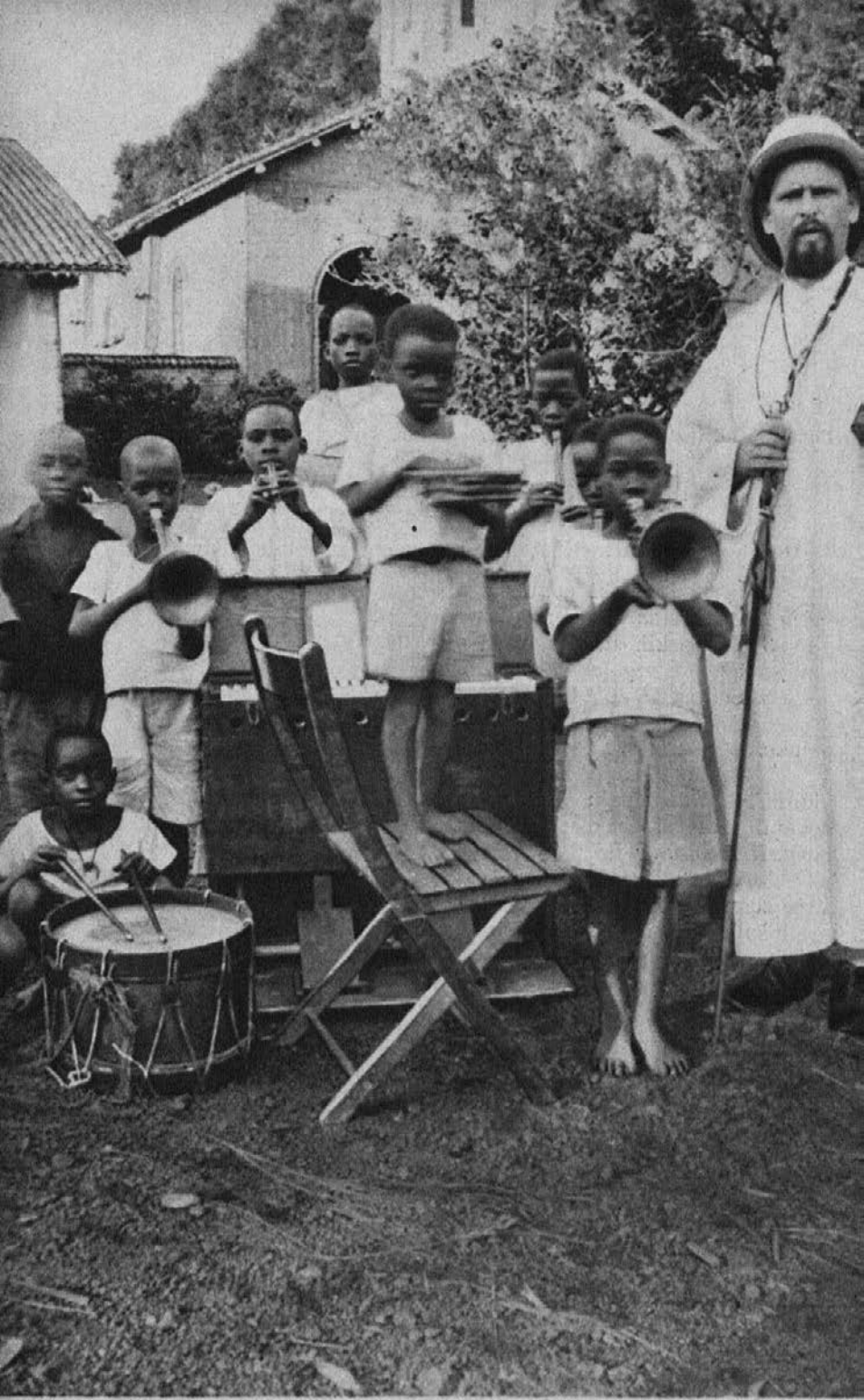
Zapojmo na glas