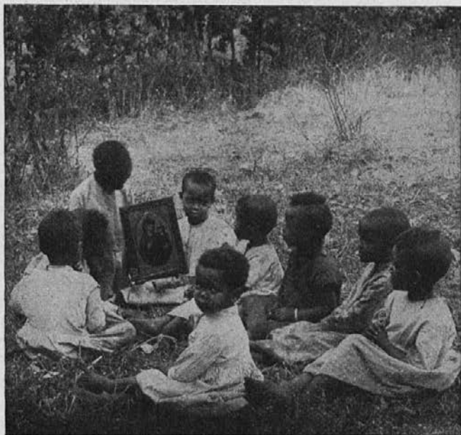
Zamorčki okrog podobe Matere božje.

Mesca julija smo imeli prvo sveto obhajilo. Neposredno pripravo je prevzel pater misijonar sam. To so bili dnevi veselega pričakovanja. Dečki in deklice, kakor tudi odrasli so podvojili svojo pridnost. K pouku ni prišel nihče