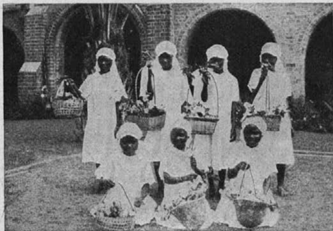
Zamorske dekllice bodo trosile Jezusu evetke.