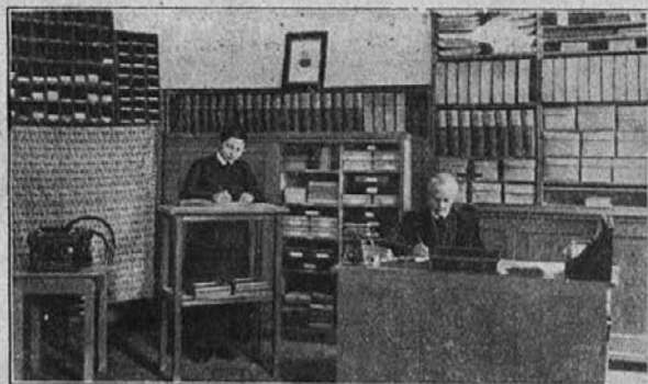
Pomožne misijonarke sv. Petra Klaverja pri svojem poklicnem delu. (Dopisovalni oddelek.)