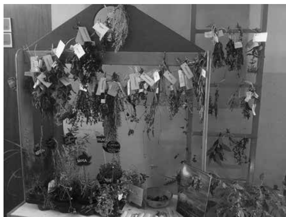
Slika 2: Zeliščni kotiček