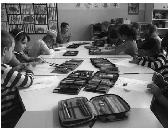
Slika 4: Risanje vsebine pravljice

ju z zelišči. Zaradi obsežnosti vsebine smo knjigo brali v nadaljevanjih. Zgodbice so otroke navduševale in z radovednostjo so čakali na nove dogodivščine. Po prebranih zgodbicah so nastajale tudi zanimive ilustracije.