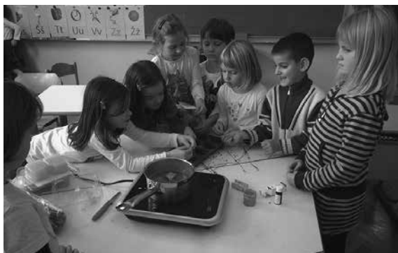
Slika 5: Vlivanje mila v kalupe

Izdelali smo mila, ki smo jim dodali posušeno sivko in jih odišavili z eteričnim oljem sivke. Nekaj naših izdelkov smo uporabili za novoletna darila.