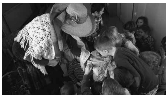
Slika 3: Pogovor s teto Pehto

V svoji opravi in s polno košaro zelišč nas je nagovorila z rekom: »Za vsako bolezen rožica raste.« Med učenci in Pehto je stekel prijeten in igriv pogovor o življenju v planinah, o Bedančevih tegobah, Kosobrinovem poznavanju rožic, Brincljevi radovednosti, Kekčevem pogumu, Rožletovi plahosti in Mojčini slepoti. Dejavnost je potekala v šaljivi klimi in učenci so dajali Pehti nasvete, ki so izhajali iz novih znanj o zeliščih. Svetovali so ji, katera zelišča naj uporabi za svoje planinske prijatelje in kako jih naj pripravi. Veliko novih informacij in bogatih izkušenj o zeliščih jim je podala tudi Pehta.