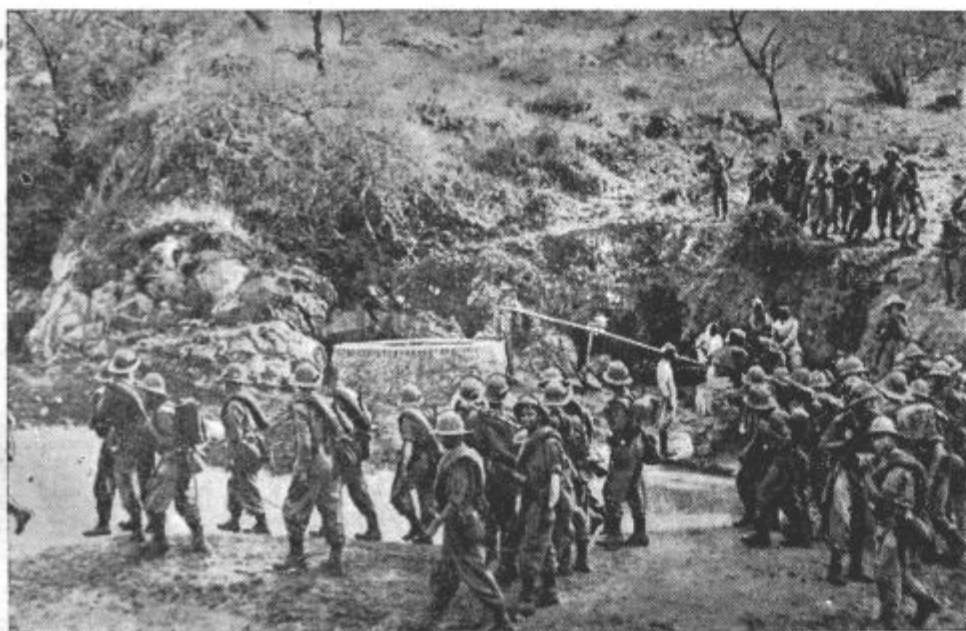
NEMŠKI PROSTVOLJCI v italijanski Vzhodni Afriki odhajajo na bojišče

× Zemljoradniki pod vodstvom predsednika glavne zveze srbskih kmetijskih zadrug Vo-