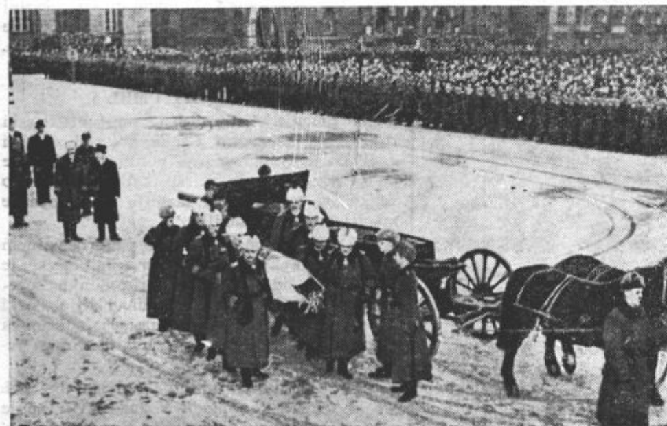
Pogreb predsednika finske republike Kallia. Njegovo krsto nesejo generali na lafeto

Med predsednikom češkega narodnega odbora dr. Benešem in predsednikom poljske vlade v emigraciji, generalom Sikorskim je bil dosežen sporazum glede eventualnega bodočega ožjega sodelovanja med Češkoslovaško in Poljsko. V to svrhu bodo ustanovljeni mešani češko-poljski odbori, ki bodo izdelali načrte za sodelovanje na političnem, gospodarskem in kulturnem polju.