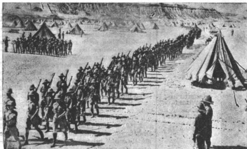
Taborišče angleških čet v Afriki in izhodne točke angleške armade pri ofenzivi na italijanske trdnjave v severni Afriki