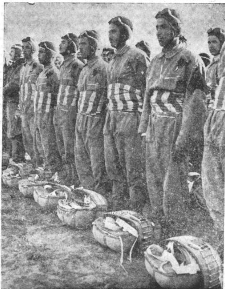
Padalci pred poletom na sovražno ozemlje. Padalci so ruska iznajdba. Pri velikih manevrih ruske vojske se je spustilo v zaledje nasprotno »vojske« na deset tisoče padalcev, ki so imeli seboj lahke tanke, strojnice in drugo brzo-strelno orožje, radijske oddajne postaje, rušilne naprave itd. Padalci so v sedanji vojni zelo uspešno uporabljali Nemci in tudi Italijani se jih poslužujejo.

Pred časom smo v nekem časopisu brali, da se je cena umetnemu gnojilu znižala, vendar je to znižanje veljalo samo do novega leta. Če vzamemo stvar resno, bi vprašali, kaj se je pri tem mislilo, ko se je znižala cena umetnemu gnojilu samo do novega leta. Ali mislijo, da kmetje rabimo umetno gnojilo za božične in novoletne potice? Kmet rabi umetno gnojilo spomladi od februarja do aprila. Komu je to znižanje koristilo? Ali ne morda samo velikim trgovcem, ki so si mogli založiti skladišča in