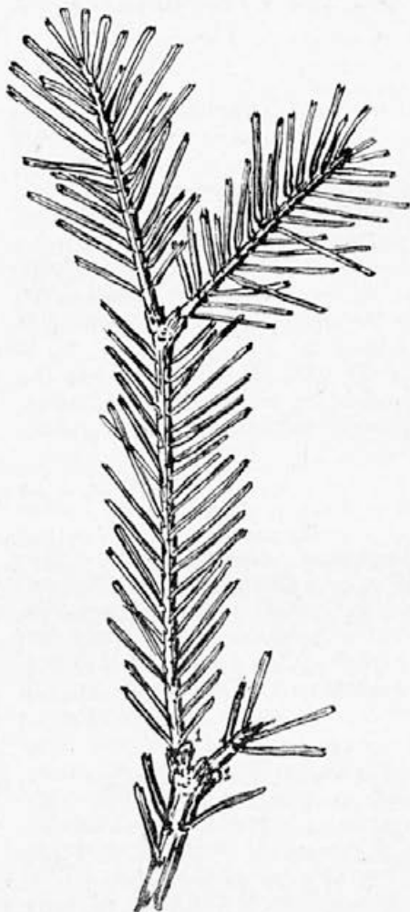
Hojeva vejica z dvema lekanijama, ki jo je narisal S. Koprivec l. 1914

Zelena ušica z dvema belima progama na hrbtu sesa na pol leta do 4 leta starih vejicah. Od začetka julija je prevladovala v večini naših hojevih sestojev. 7. julija je imelo med 50 gozdnimi opazovalnicami bero na hoji 26 kontrolnih panjev. Zato upravičeno lahko rečemo, da je najpomembnejša lahnida naših hojevih gozdov.