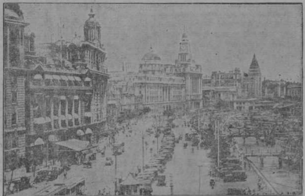
Kitajsko pristanišče Šanghaj, katerega so Japonci zasedli.