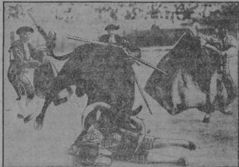
Bikoborbe na Španskem. Na sliki vidimo bika, ki suva po tleh z rogovi bikoborca, kateremu hitijo na pomoč tovariši od vseh strani.