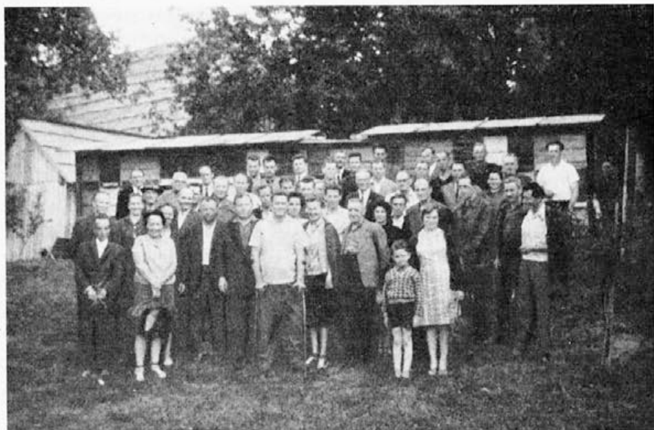
Soštanjsko čebelarstvo društvo je zelo delavno in prizadevno. Vsako leto priredi za svoje člane nekaj predavanj. Eno je vselej pri kakem čebelnjaku. Na sliki so čebelarji iz Soštanj in okolice pri letnem čebelnjaku tovariša urednika

Na splošno pa je dodajanje matic z matičnico že zastarela stvar. To opravimo tako, da vzamemo s sata staro matico in na isto mesto damo mlado, ki jo v poletnih mesecih pomožimo v sladek čaj iz termovke. Spomladi pa to sploh ni potrebno. Ob tej priložnosti matico lahko zaznamujemo in ji odrežemo približno 2 mm enega krila, tako da ne more odleteti pri rojenju.