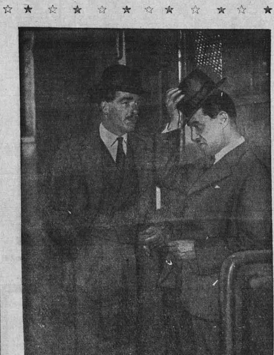
Kap. Edén zastopa Anglijo pri sedanjih pogajanjih v Ženevi. Pred nedavnim se je mudil v Parizu. Na sliki ga vidimo v družbi franc. drž. podtajnika Roc hata

Dne 6. septembra bo mladi kralj Peter II. obhajal 12. obletnico svojega rojstva. Vlada je izdelala poseben program za slovesnosti, ki se bodo vršile ob tej priliki. V Beogradu bo na ta dan velika vojaška parada.