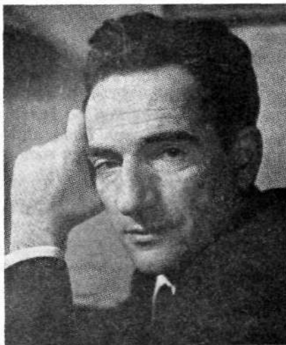
Oskar Davičo (1909)

... poezija ne osvetljuje neznanega z znanim. Bolj pogostoma — narobe: znano z neznanim. Ko pesniki izhajajo s točk izven fokusa človečnosti, izgovarjajo psihično središče človeka. Tako nekako, kot so nekoč neki osnovnošolci izgovarjali tisti stih, ki je žarel iz oči pogumnih (a kateri človek ni pogumen?) in pozival, da se »za kapljo neznanega« dá vse znano.