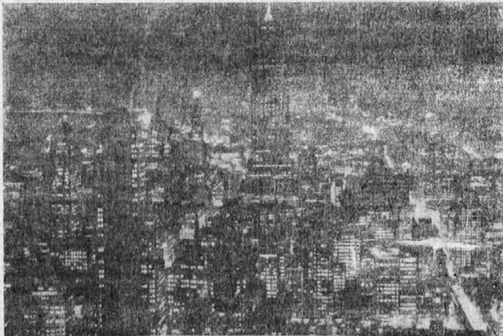
Newyork v bajni razsvetljavi

Sadje in zelenjava vsebuje približno 90 procentov vode, to se pravi one vo-