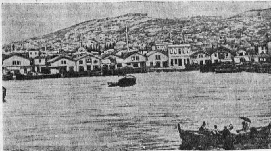
POGLED NA SMIRNO

vinsko ljubezen Sulejmana paše. Pred eno uro sem namreč doznal iz povsem gotovega vira, da se nahaja pri njem v bulairskem taborišču ruski odposlanec, za katerim norijo vsa lepa galipolska dekleta in ki mu je na prosto dano, da lahko neovirano stopa v Sulejmanove prostore, kadarkoli si tega zaželi. Kaj to pomeni, je dovelj jasno: Sulejman naj prodirajočim Rusom izroči utrdbe, jaz pa sem za svojo osebo prepričan, da bo ta s... Rusom res izročil te utrdbe. Potem