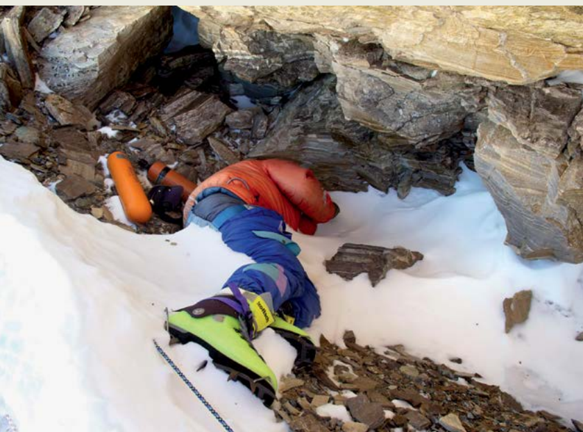
Green boots, Zeleni škornji – ime, ki ga je dobilo telo plezalca, ki je postalo mejnik na glavni severovzhodni grebenski smeri na Mount Everest. Telo uradno ni bilo identificirano, vendar naj bi bil to Tsewang Paljor, indijski plezalec, ki je umrl na Everestu leta 1996.