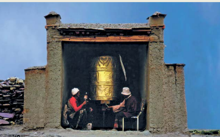
Molino kolo

Na pogostitev takoj po pogrebu, kakor je navada danes, so bili včasih povabljeni samo nosači, sedmina ali osmina pa je bila sedmi ali osmi dan po pogrebu, ko se je brala tudi črna maša zadušnica.