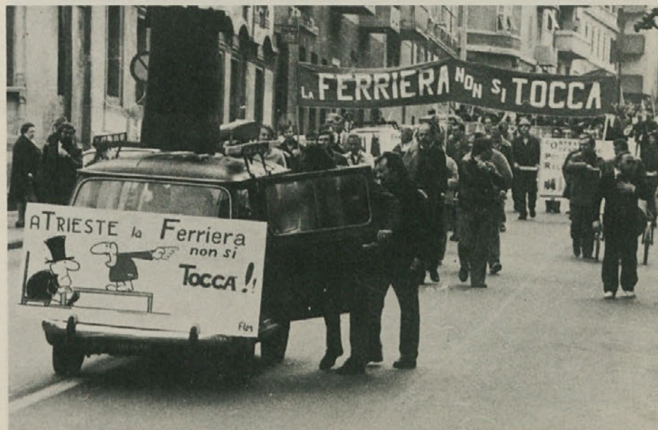
Metalurški delavci terjajo ukrepe za ohranitev tržaške jeklarne.

Vse te možnosti so sedaj odpadle, ker se o tem ni mogla razviti javna razprava v občinskem svetu. Vsakdo naj si sedaj prevzame svoje odgovornosti.