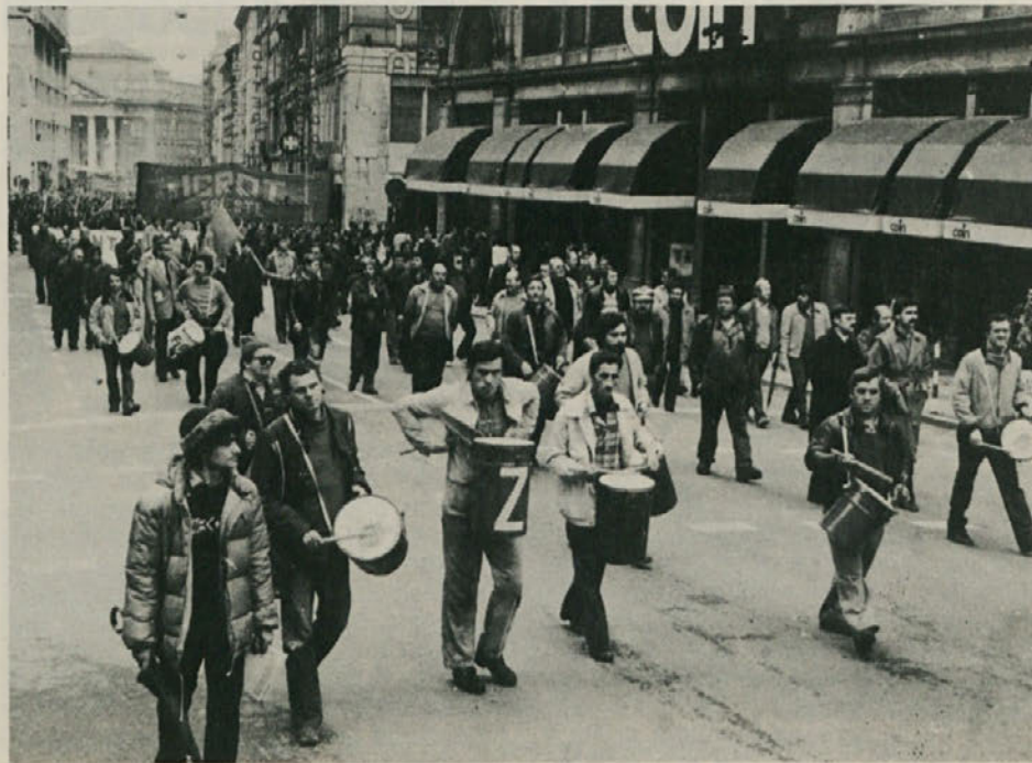
Delavski sprevid po tržaških ulicah.