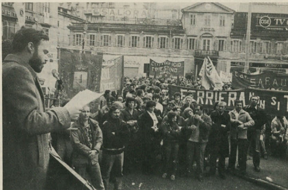
Sindikarno zborovanje na Goldonijevem trgu.

No, če bi senatna komisija prišla v naše kraje, bi scenarij bil zelo verjetno podoben onemu, kakršnega je doživela pristojna poslanska komisija med vi-