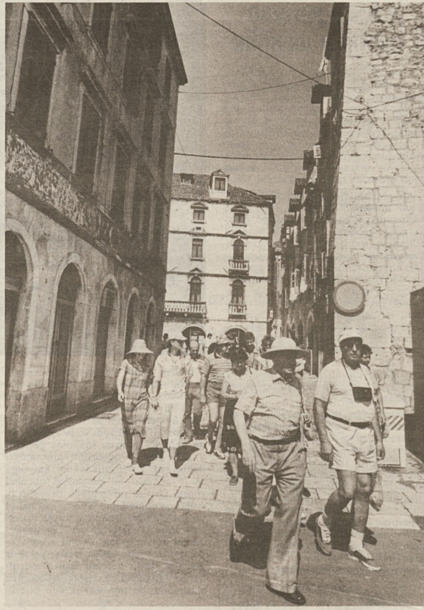
Tako je nekoč zgedel Split, ki je bil kot druga dalmatinska mesta, cilj številnih turistov. Upati je, da se bo turistična reka spet okrepila