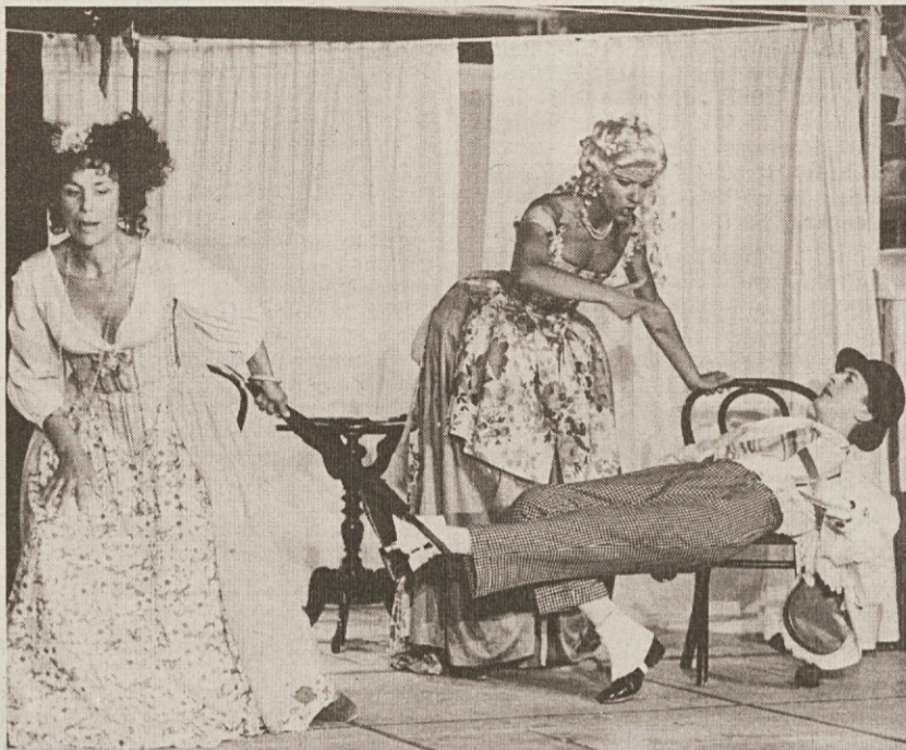
Prizor iz Goldonijeve Prebrisane vdove

V Prebrisani vdovi se Goldoni loti fenomena mladih vdov. Takratna družbena konvencija je velevala poročati mlade ženske s starejšimi moškimi. Na svoj račun so resda prišli osvigli starci, toda nevarna posledica te družbene prakse je bila precejšnja množica zgodaj ovdovelih žensk, ki je spričo nezadovoljstva in odrinjenosti od družabnega življenja predstavljala nevaren element socialne nestabilnosti. Ne le, da so bile mlade vdove skušnjava samskim mladeničem,