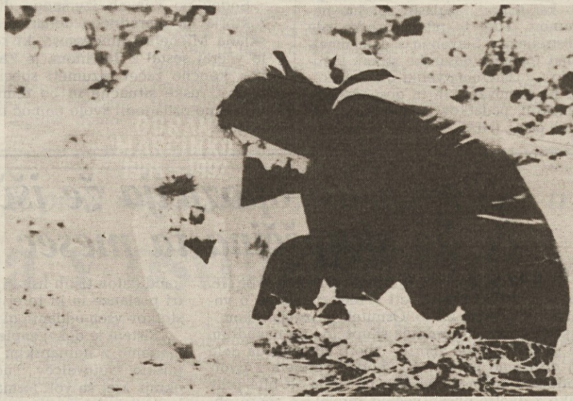
Mati objokuje svojega sina, ki je padel med bombardiranjem Sarajeva