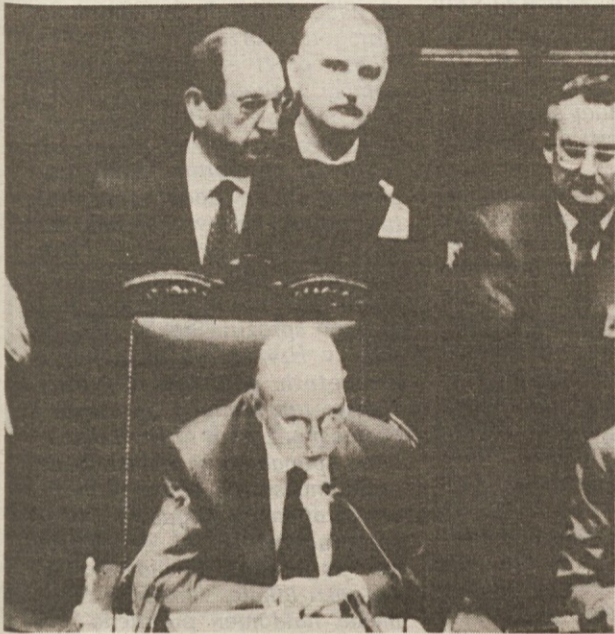
Predsednik poslanske zbornice Napolitano med branjem izidov glasovanja

Za zaupnico 330 poslancev, proti pa 280 - V repliki Amato dal največ poudarka sanaciji gospodarstva - Med prioritete naloge uvrstil zmanjšanje javnega dolga in zaščito lire