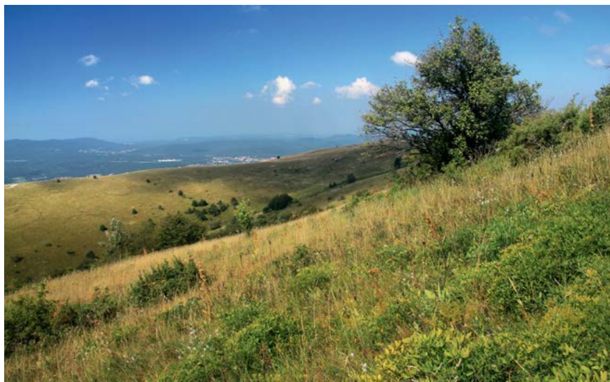
Travnate poljane Vremščice

tju. Gora slovi po pestrem gorskem cvetju, v maju tod cvetijo tudi narcise. Vrh slovi po izjemnih razgledih od Alp do morja. Na vrhu je pogosto vetrovno, posebej v hladni polovici leta se moramo pripraviti z ustreznimi oblačili. Vzpon na vrh lepo povežemo z obiskom Parka Škocjanske jame.