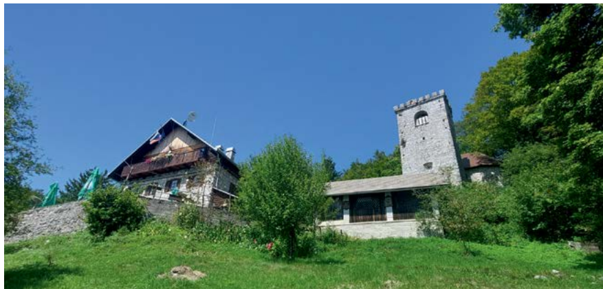
Planinski dom na Mirni gori

Zaključek: Železniška postaja Črnomelj, 180 m