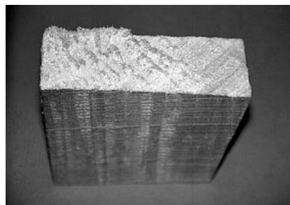
Slika 1. Topol ( Populus spp.): značilna volnatost zaradi velikega dela tenzijskega lesa

Beli les je popularen nestrokoven izraz za reakcijski les listavcev, tj. tenzijski les. Tenzijski les se tvori na zgornji strani nagnjenih debel in vej. Zlasti lepo se vidi na suhih skobljanih površinah, kjer se srebrnkasto leskeče, ali pa na svežih žaganih površinah, kjer ga izdaja "volnatost" (angl. fuzzy grain ). Volnatost je posledica iz površine iztrganih zelo žilavih tenzijskih ali želatinskih vlaken (slika 1).