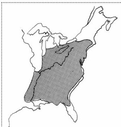
Slika 2. Areal sambe ( Triplochiton scleroxylon K. Schum.)

alni Afriki. Pri nas poznamo njen les večinoma pod imenom samba . Vendar ga tako imenujejo predvsem na Slonokoščeni obali. V Gani se imenuje wawa , v Nigeriji in Liberiji abachi ali obeche , v Kamerunu, Centralnoafriški republiki in Kongu (Zaire in Brazzaville) pa ayous . Iz teh provenienčnih domačinskih imen (seveda če jih trgovci ohranijo in prenesejo na tržišče) je potemtakem mogoče sklepati na geografski izvor in lesne posebnosti sicer botanično iste drevesne vrste. (slika 2).