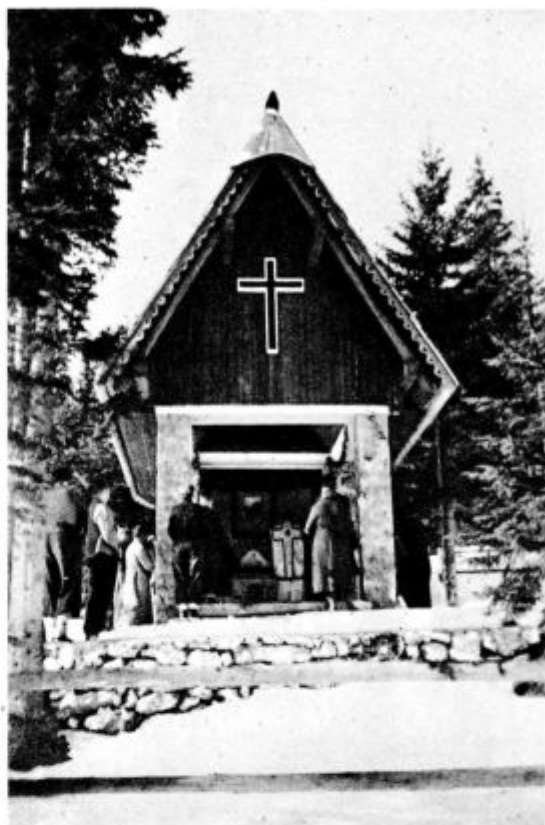
Nova kapelica na Pokljuki (Glej opis „Naše slike“.)

Četudi ti od molitve ne bi bilo nič posebnega pričakovati, pa že moraš moliti — zakaj? Zato, ker si stvar svojega Stvarnika ubogo omejeno bitje, ki si en sam živ in velik »vbógajme« svojega Boga in Stvarnika, z vsem, kar si in kar imaš. Človeško naravo imaš: svéta, neizbrisna dolžnost človeške ustvarjene narave pa je, da svojega Boga in Stvarnika priznava, moli, časti in slavi. Ta dolžnost je tako v zvezi z resnico, da imaš človeško, od Boga ti dano naravo, da te — če govorimo po človeško — še