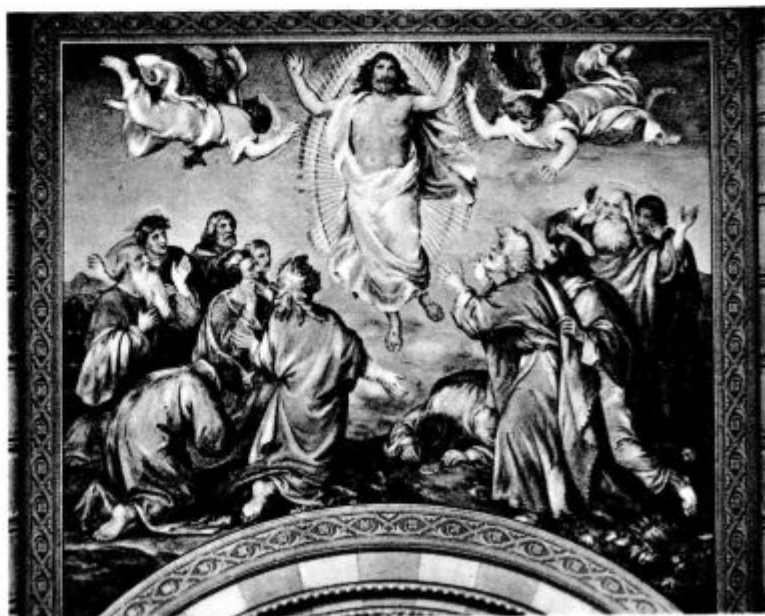
Vnebohod Gospodov (Posnetek iz djakovske stolnice.)

Glej, to je prva moč, prvo zdravje — v posvečujoči božji milosti moraš biti. Potem nisi samo sin zemlje, nisi zgolj