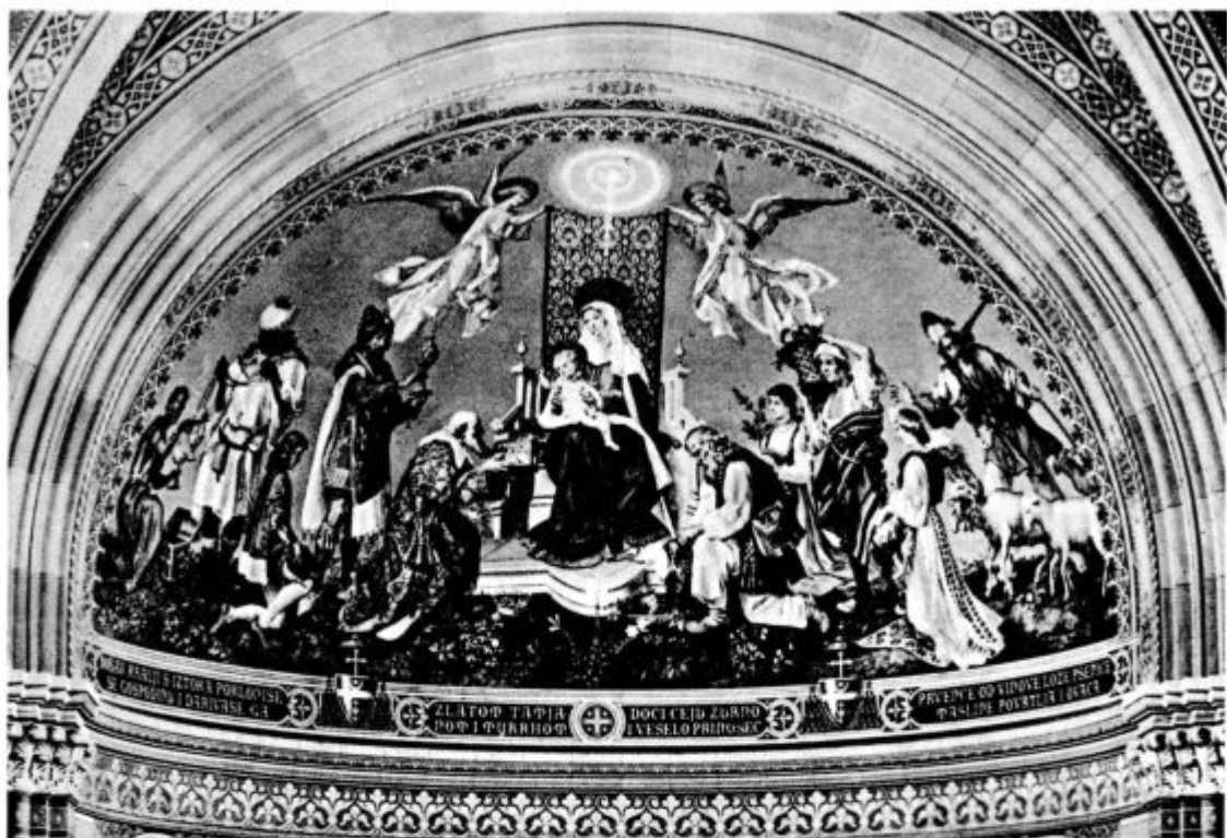
Darove prinašajo (Posnetek iz djakovske stolnice.)

ljih, da bi izbrisal vsak spomin nanjo iz človeških src, posebno pri mladini. Škofe in duhovnike so pregnali, obsodili na prisilna dela, ustrelili in nečloveško usmrtili; preproste svete ljudi so zato, ker so branili vero, osumili, grdo z njimi ravnali, jih preganjali in vlačili v ječe in pred sodišča.»