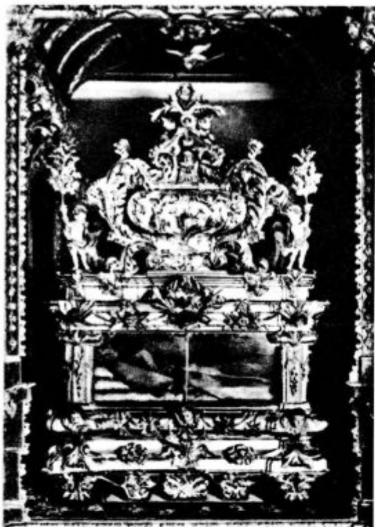
Grob sv. Paskala, zaščitnika častilcev sv. R. T. (God 17. maja.)

človek, nisi samo iz duše in telesa, ampak: iz duše, telesa in — Sv. Duha, tedaj si kristjan in otrok božji.