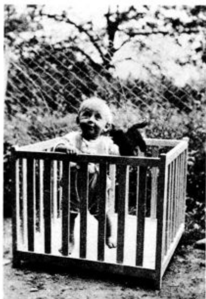
V varni trdnjavi