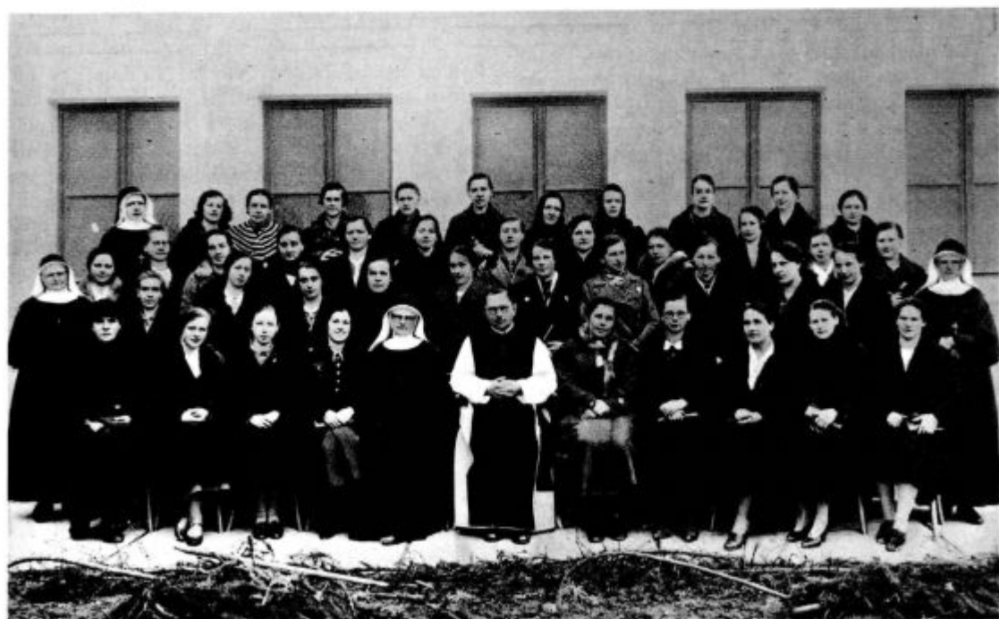
Udeleženske duhovnih vaj na Mali Loki (15. — 17. februarja 1937.)

Tudi Aram Bela ima nemirno noč. Saj hoče jutri, na belo nedeljo, dobiti »takšno hostijo« in ta naklep še v sanjah tako zapo- sluje njegovo domišljijo, da večkrat plane po- konci in zakliče »Kdo je?« Sele dolgo po pol-