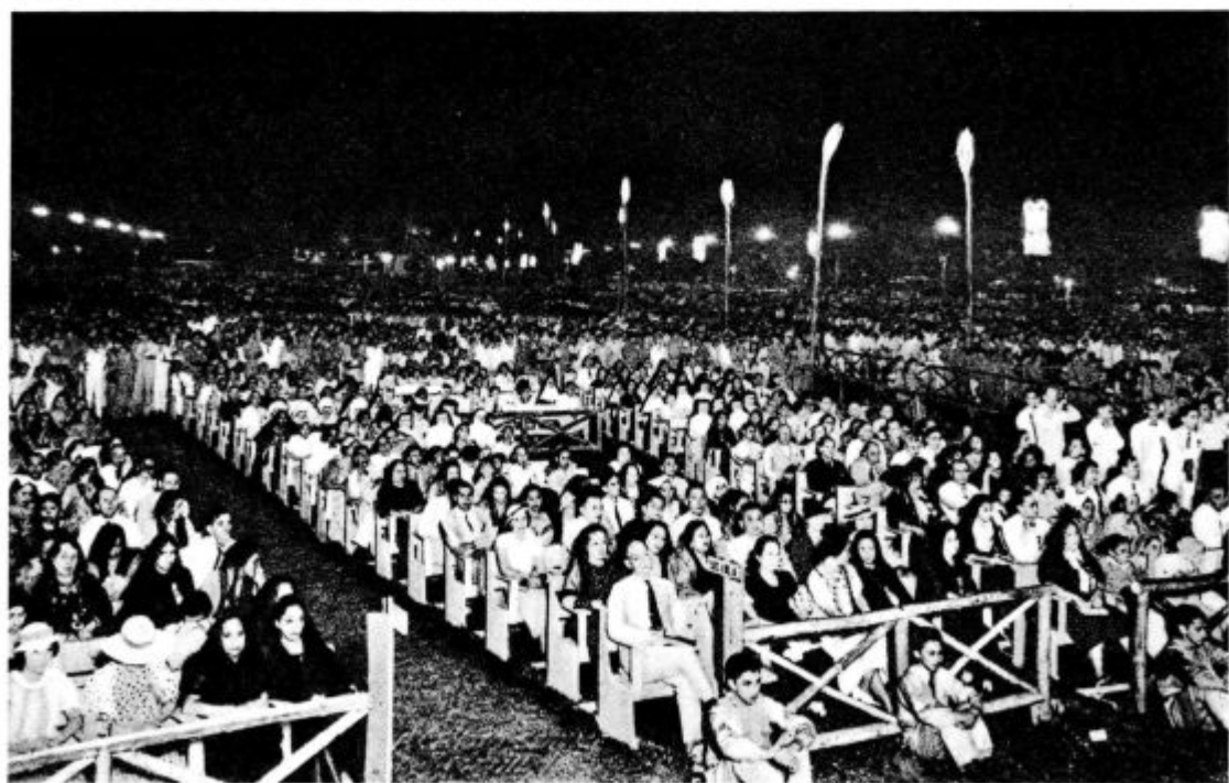
Evharistični kongres v Manili: Udeleženci poslušajo svetega očeta Pija XI., ki je govoril v vatikanski radiofonski postaji