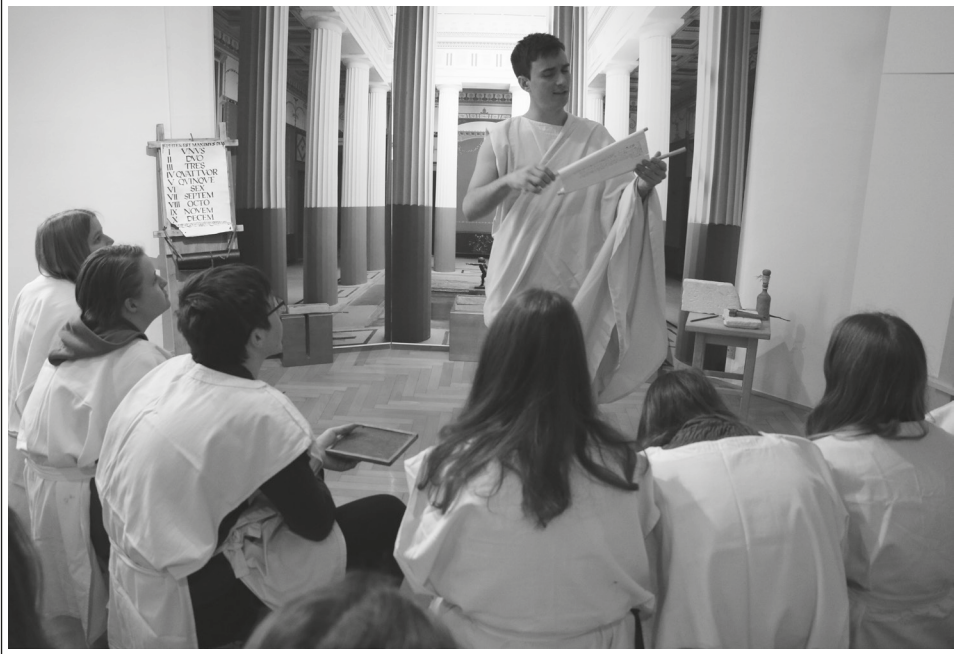
Učna ura Antična Emona.

Najprej omenimo učno uro Antična Emona , ki sega v 1. stoletje. Na poseben način pritegne obiskovalce, ker se lahko vživijo v vlogo učencev pred dva tisoč leti. Oblečejo se v rimska oblačila (tunike), kot so jih nosili takratni učenci. Svojevrsten prispevek v tej učni uri ima učitelj – magister s svojim oblačilom (togo), posebno obutvijo ter učnimi pripomočki (zvitkom z latinskimi zapisi, voščenenimi tablicami s stilusi), značilnimi za takratni čas. Namen te učne ure je, da obiskovalci spoznajo način poučevanja in vzgajanja v tistem času. Cilj je, da se naučijo nekaterih latinskih besed, zlasti kako se pozdravi, predstavi, učijo se pisanja rimskih števil, latinskih imen za mesece idr. Posebej je pomembna izkušnja, da se učijo pisanja latinskih izrazov na voščene tablice s stilusom kot v rimskem času. Vzgajajo pa se na podlagi antičnih zgodb o Veneri in Marsu ter se pogovarjajo o bogovih iz rimske mitologije. 19