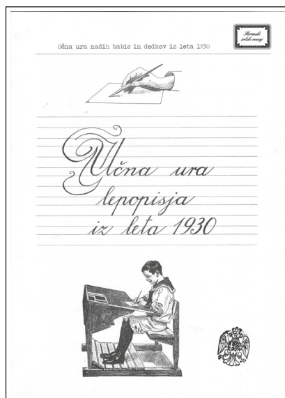
Učni list za učno uro Lepopis iz leta 1930 (Slovenski šolski muzej, dokumentacija).

Učna ura Telovadba je prav tako iz obdobja Kraljevine Jugoslavije (1932). Namen te je, da se obiskovalci kot učenci učijo telesnih spretnosti po sokolskem načinu. Izvajajo telesne vaje (pravilna stoja oz. drža telesa, nastop v vrstah do štiri osebe, hoja, tekanje v vrsti, proste vaje na mestu, obračanje na desno in levo) in različne igre. Pri tej učni uri se učijo določenih spretnosti in gotovosti v gibih, še posebej pa je poudarek na vzgoji vsakega posameznika, saj naj bi razvili odločnost, samozavest, se navajali na lepo in dostojno vedenje. 24