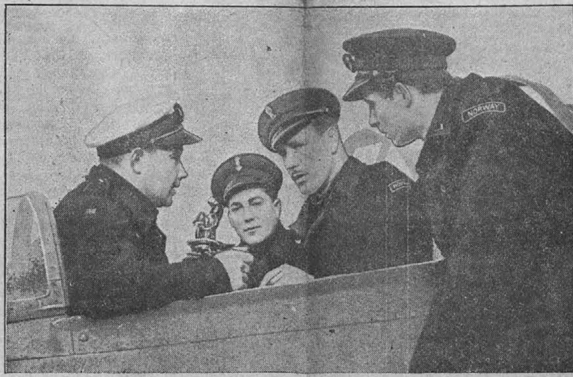
Angleški zračni sili je pridruženih mnogo norveških letalcev, ki pomagajo kontrolirati morje, po katerem plovejo zavezniški konvoji v Anglijo, Islandijo in v Rusijo. Na gornji sliki je skupina norveških letalcev, ki prejema zadnja navodila pred odletom.