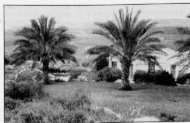
Pogled na vasico