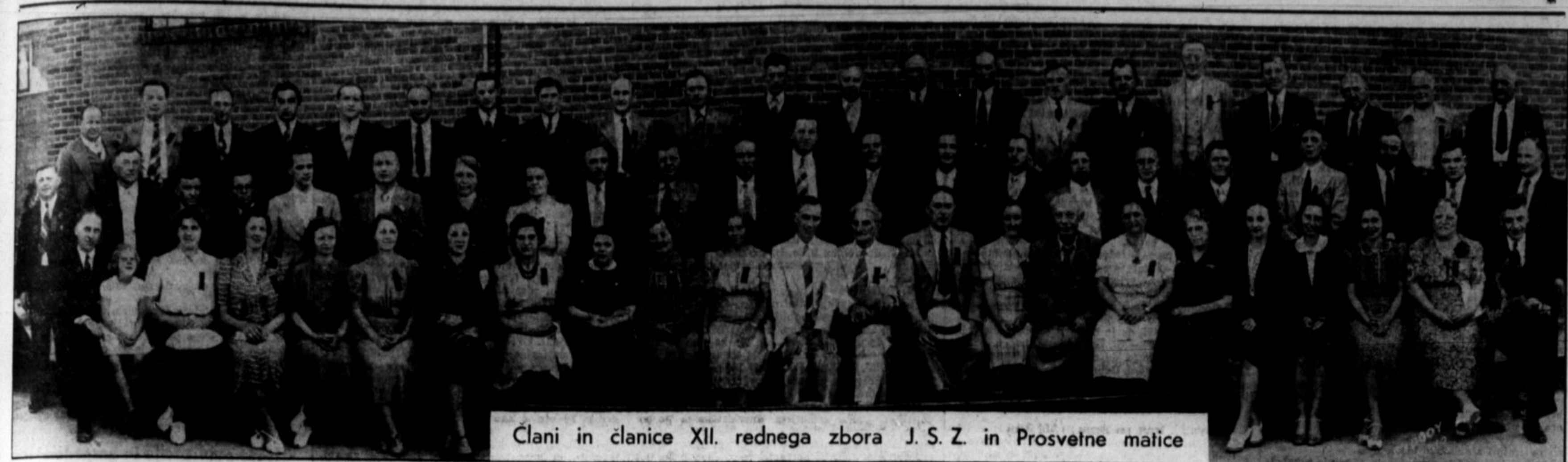
Člani in članice XII. rednega zbora J. S. Z. in Prosvetne matice

Dvanajsti redni zbor JSZ in Prosvetne matice, o katerem je zapisnik v tej prilogi Proletarca, se je vršil dne 4., 5. in 6. julija 1940 v Slovenskem delavskem domu na Waterloo Rd., v Clevelandu, Ohio. Nekaj članov zbora ni na sliki.