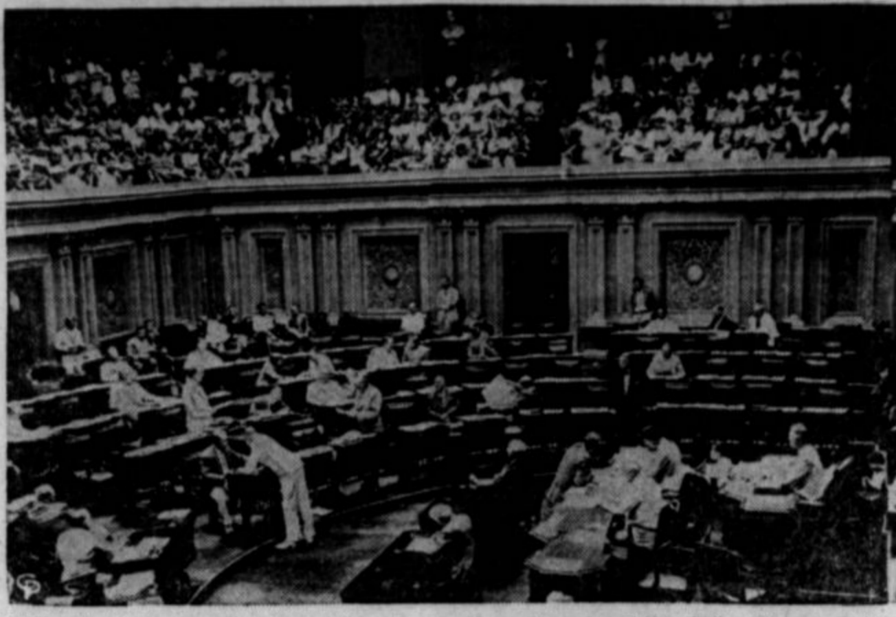
Približno dva tedna neprestane borbe je vzel senat o predlogi za uvedbo prisilne vojaške službe v Zed. državah. Odobril jo je z 58 proti 31 glasovi na svoji nočni seji 29. avgusta. Ako in kadar jo odobri tudi zbornica poslancev, se bo moralo registrirati okrog 12 milijonov moških v starosti od 21. do 31. leta. Dodatna predloga iz zbornice poslancev določa, da naj se pozove na registriranje moške do 45. leta starosti, ki bi pomenilo še precej milijonov več.

To je prvič v mirnem času, da je senat sprejel pred-