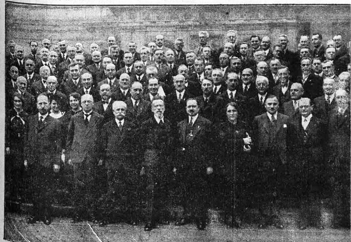
S jesenje skupštine ČOS u Pragu dne 8 i 9 o. m.