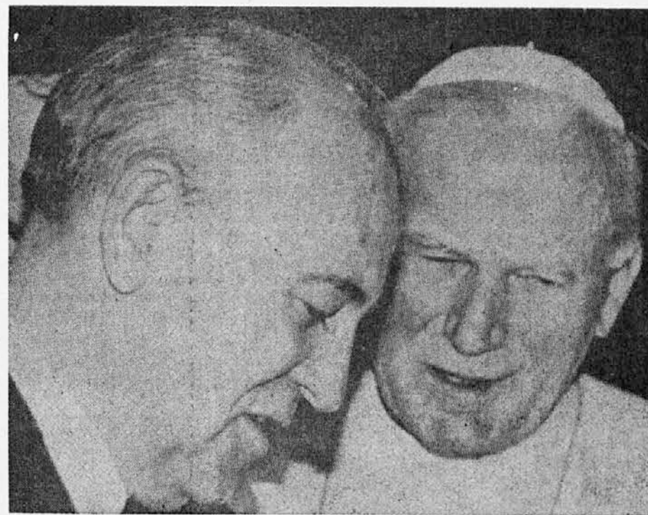
Papež Janez Pavel II. v pogovoru z ruskim voditeljem Gorbačovom

Višek obiska v Rimu pa je za sovjetskega voditelja predstavljala obisk v Vatikanu, kjer ga je v posebni in nadvse dolgi avdienci sprejel papež Janez Pavel II. Marsikateri italijanski listi so pri tem pisali o pogovoru med dvema Slovonom. In res sta se ruski predsednik in poljski papež srečala v pristrnem in ne-