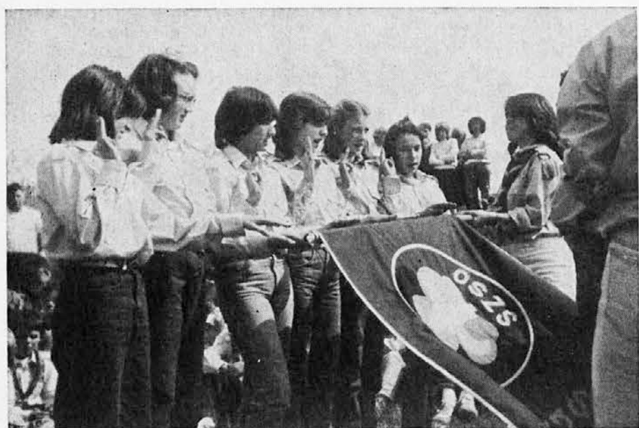
Skavtinja pri obljubah