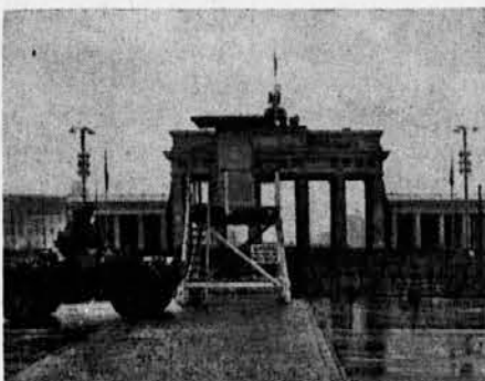
Brandeburška vrata v berlinskem zidu

★ Ali jeste ali pijete, vse delajte v čast božjo in hvaležni bodite. (Sv. Pavel)