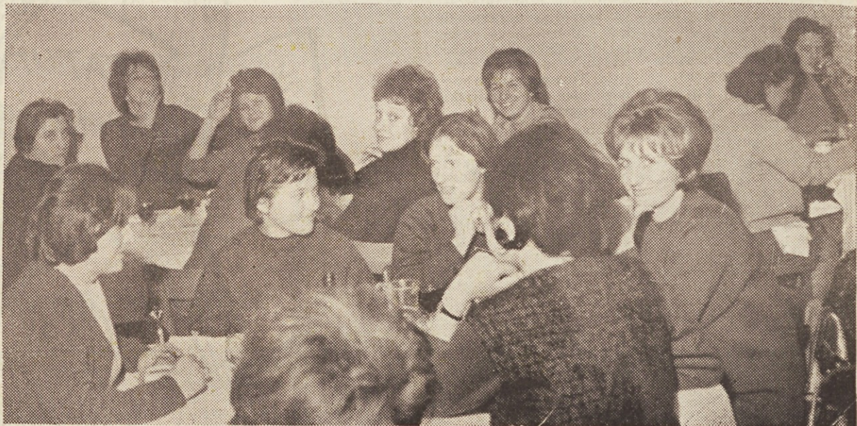
Naše tovarišice so veselo proslavile mednarodni ženski dan

V gradbeništvu si ga še marsikje ne vedo drugače predstavljati kot takole