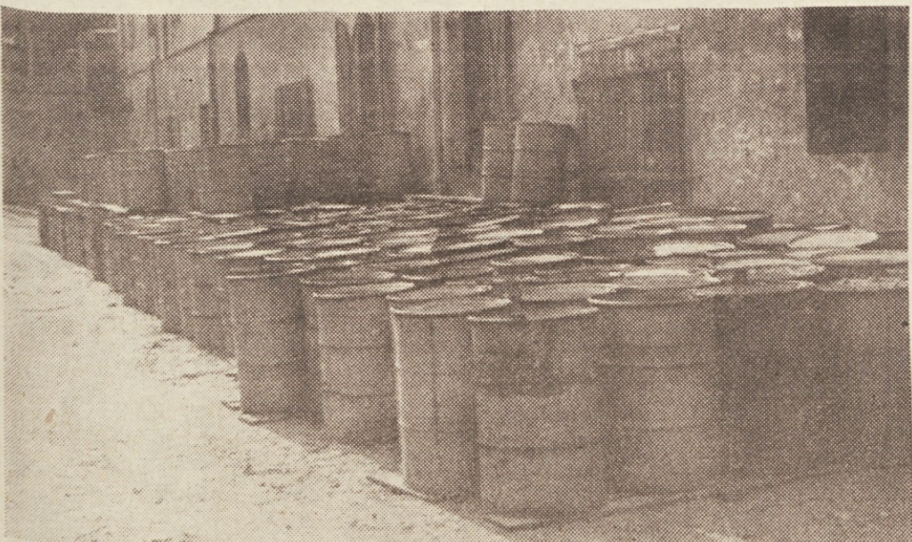
Statut podjetja je bil razmnožen v 10.000 izvodih. Odpremna služba podjetja bo statut poslala vsem poslovnim enotam v posebnih sodih tako, da se med potjo ne bi mogel pokvariti. Sodi so, kot vidite, že naredi.

3. Glede na to, da postajajo specializirane ekonomske enote v našem podjetju že stvarnost, si dobro organiziranega dela brez teleprinterske zveze med poslovnimi enotami kakor tudi med specializiranimi enotami sploh ne moremo zamisliti. Če bo kateri enoti zmanjkalo žebličev, bo lahko po teleprinterju obvestila o tem vse enote Gradisa naenkrat in ni vrag, da bi jih katera izmed enot ne imela. Nadvse pomembna pa je taka zveza tudi v primerih, kadar začne kateri izmed enot nenadoma teči voda v grlo.