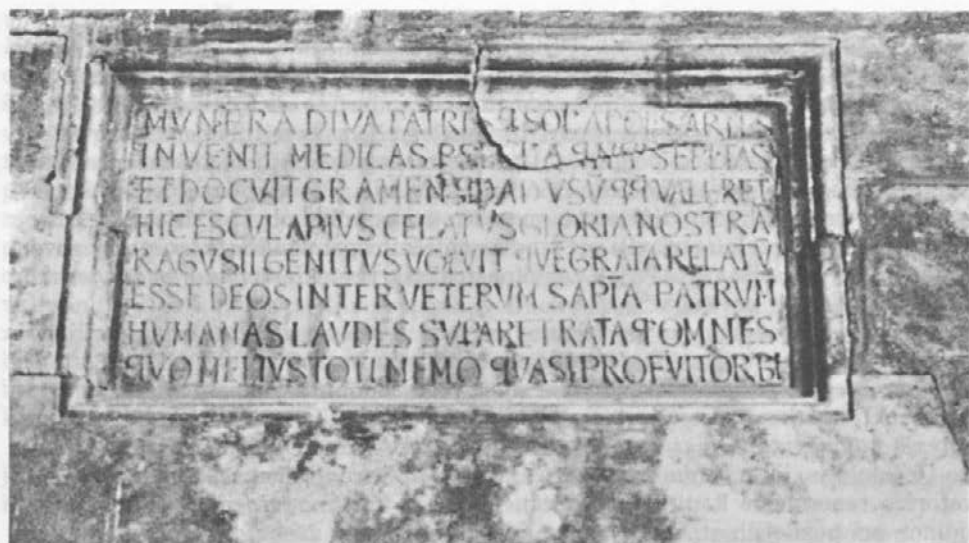
Sl. 1: Dubrovnik, Knežev dvor, Eskulapov napis (okoli 1440).