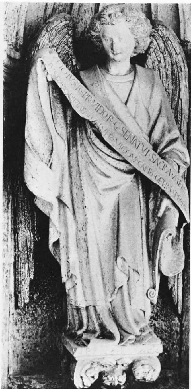
Sl. 5: Dubrovnik, Knežev dvor, kip IEPA BOYAH (1448/9?).