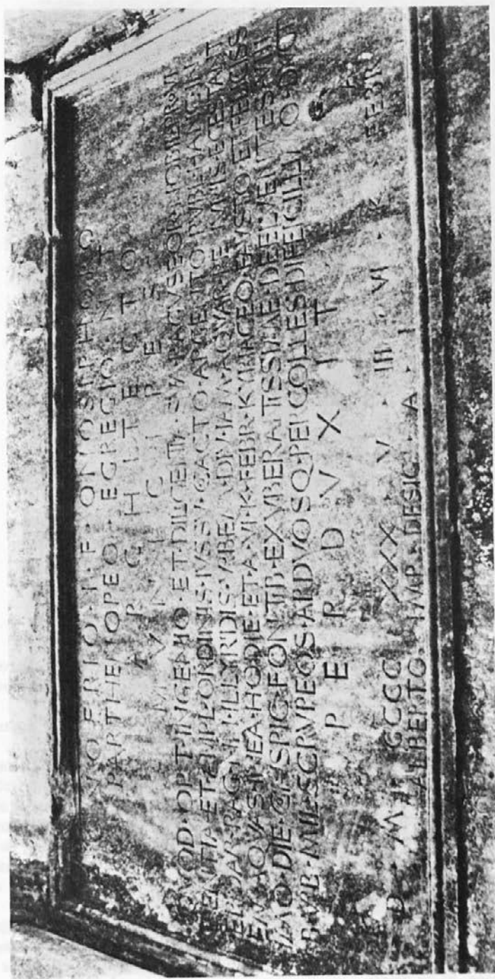
Sl. 2: Dubrovnik, Velika fontana, napis Ciriaca d'Ancona (1443-1446). Fig. 2: Dubrovnik, The Big Fountain, Inscription by Ciriacus of Ancona (1443-1446).