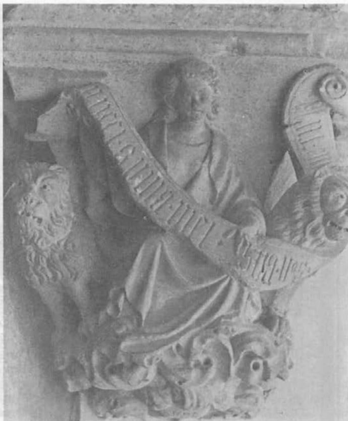
Sl. 3: Dubrovnik, Knežev dvor, Iustitia (pred 1440).