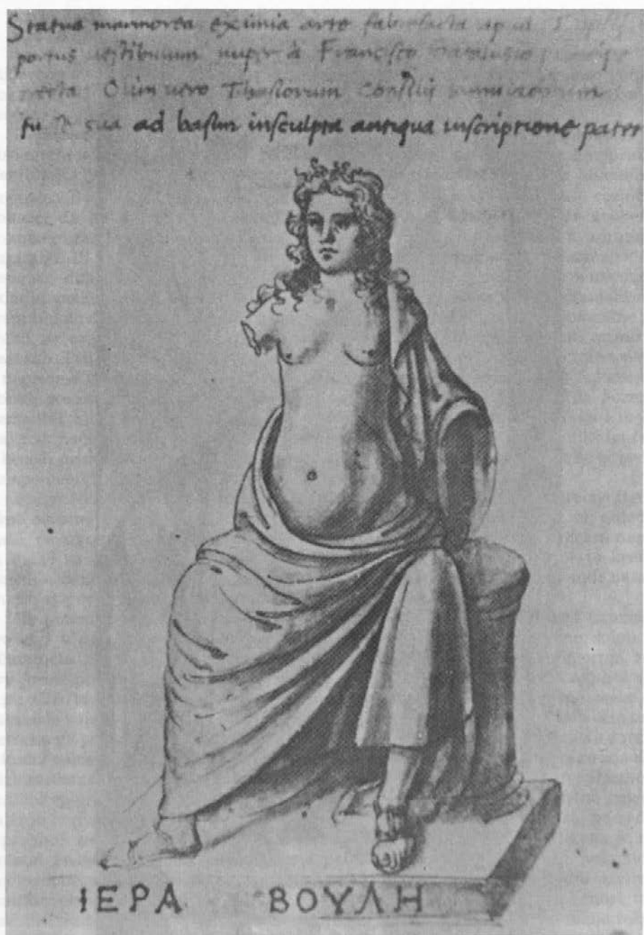
Sl. 6: Risba kipa nekdanj na Tasosu, po Ciriacu d'Ancona (okoli 1475).

Fig. 6: Drawing of a Statue once in Thasos, after Cyriacus of Ancona (about 1475; Oxford, Bodleian Library, Cod. Lat. Misc. d. 85, fol. 139v).