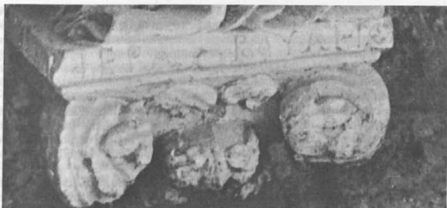
Sl. 7: Dubrovnik, Knežev dvor, napis na podstavku kipa s sl. 5.