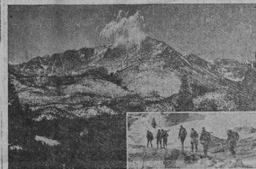
Na sliki vidimo 14,109 čevljev visoko goro Colorado peak v državi Coloradi. Na desni je skupina planincev, ki se bo dne 31. decembra vzepla na vrh te gore.