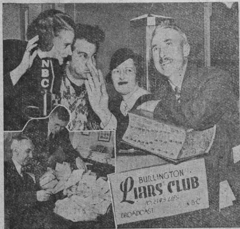
Na sliki so odborniki Kluba lažnivcev, ki ima svoj sedež v Burlingtonu, Wis. Dne 31. decembra bo ta klub določil, kdo izmed njegovih članov je bil leta 1940 največji lažnivec.