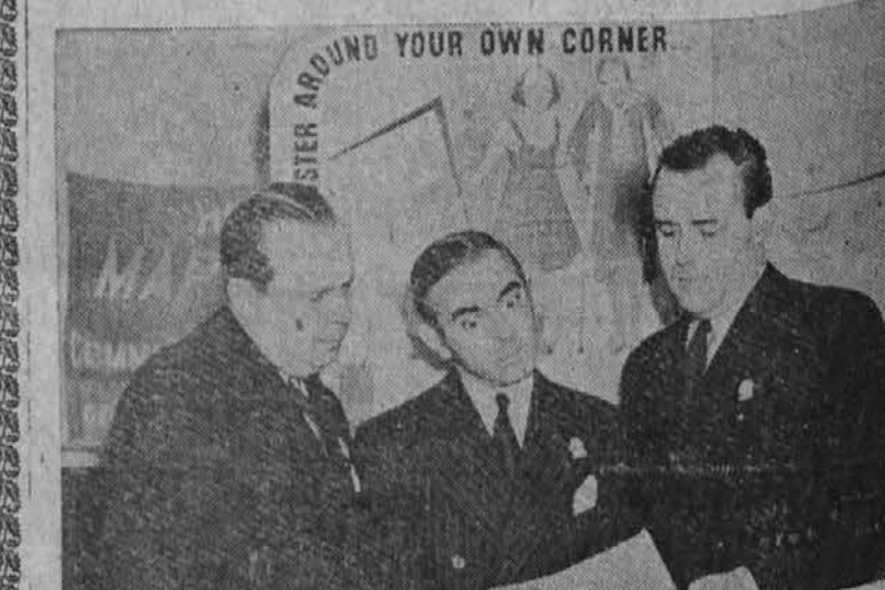
Predsednik Roosevelt je avtoriziral svoj rojstni dan, 30. januarja, da se sme ta dan zbirati prispevke za boj proti otroški paralizi. Na sliki je odbor te kampanje; srednji na sliki je Eddie Cantor, znani igralec in pevec.