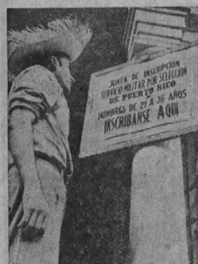
Na sliki vidimo prebivalca Puerto Rica, ki čita razglas, da je uvedena v deželi prisilna vojaška obveznost.