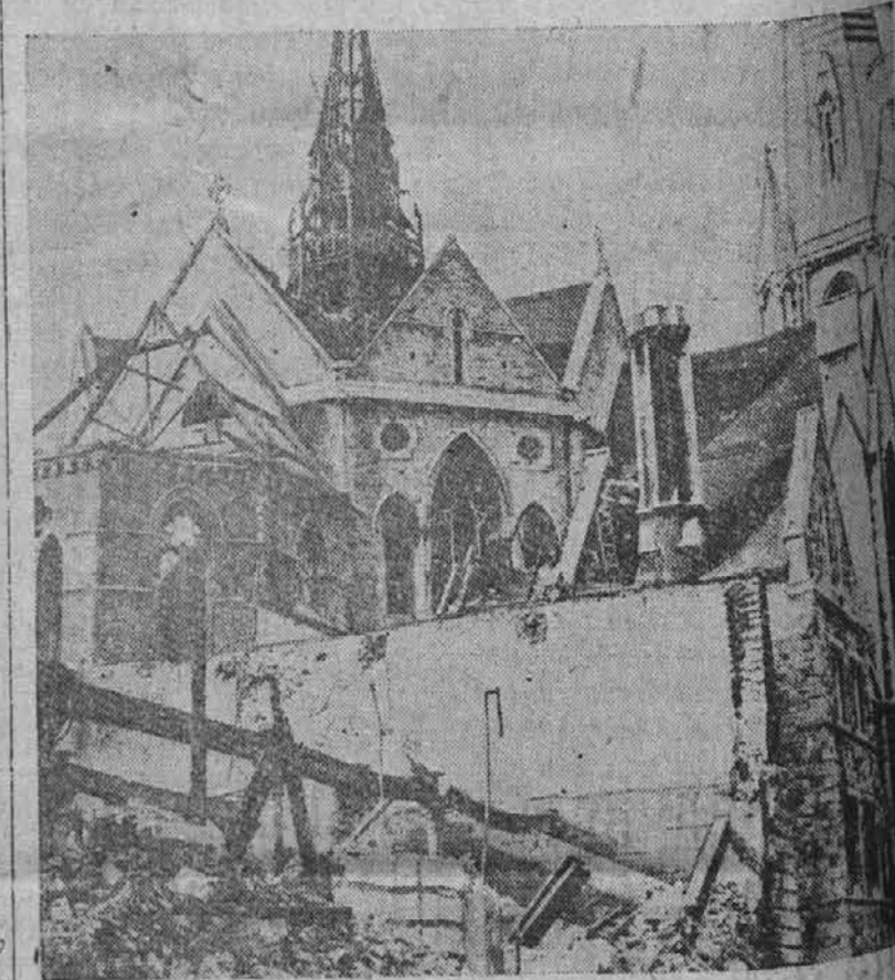
Na sliki vidimo ruševine Kristove cerkve v Londonu, ki je bila nedavno poškodovana po nemških zračnih bombah.