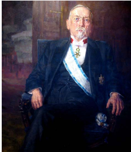
Portret ljubljanskega župana Ivana Hribarja je ustvarila slikarka Ivana Kobilca