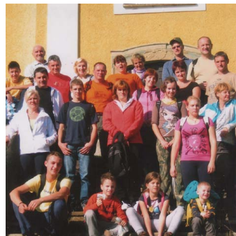
Fotografirali smo se kar na stopnišču pred cerkvijo.