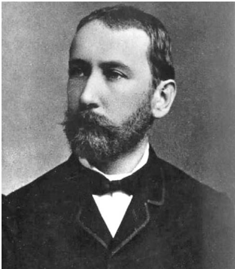
Ivan Hribar v mladostni dobi

Ivan Hribar, ljubljanski župan med letoma 1896 in 1910, je bil zagotovo svojevrstna politična osebnost 19. in 20. stoletja. V svojem bogatem življenju, ki se je začelo sredi 19. stoletja v Trzinu, je opravljal številne funkcije; med drugim je bil slovenski bančnik, politik, diplomat in publicist. V času svojega županovanja je pomembno prispeval k razvoju Ljubljane, še posebej pa je bil zaslužen za popotresno obnovo mesta.