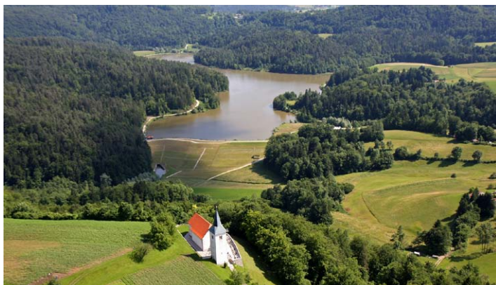
Pogled na Gradiško jezero