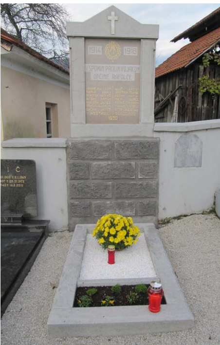
Obnovljeni spomenik padlim vojakom prve svetovne vojne

Na pokopališču v Rafolčah že 82 let stoji spomenik padlim v prvi svetovni vojni. Zob časa ga je načel do te mere, da so svojci že pred časom pozivali in tudi poslali prošnjo odgovornim za obnovo. Krajevna skupnost Rafolče in Občina Lukovica sta letos jeseni vendarle našli posluh in sredstva, da je bil v začetku novembra ta spomenik vendarle tudi temeljito obnovljen.