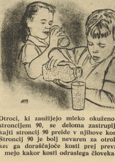
Otroci, ki zaužijejo mleko okuženo s stroncijem 90, se deloma zastrupijo; kajti stroncij 90 preide v njihove kosti. Stroncij 90 je bolj nevaren za otroke, ker ga doraščajoče kosti prej prevzamejo kakor kosti odraslega človeka.