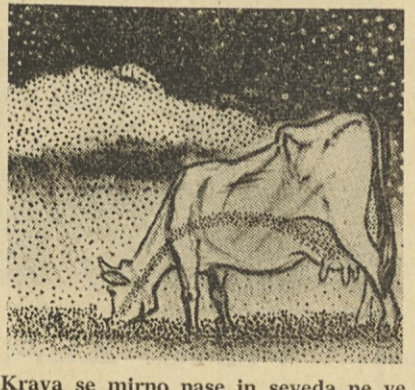
Krava se mirno pase in seveda ne ve, da požira travo, ki je bila okužena z radioaktivno snovjo — s stroncijem 90. Ta je padla pomešana z dežjem visoko iz stratosfere, kamor jo je pognala razstrelitev atomske bombe. Radioaktivne snovi se vzdignejo po razstrelitvi okoli 12 km visoko. Del teh snovi ostane v ozračju tudi 7 let, toda približno polovica jih pade na zemljo že v 30 dneh po eksploziji. Radioaktivna snov stroncij 90 sodi k tisti kemični družini kakor kalcij, ki se lahko asimilira. Nekaj stroncija ostane v sagem kravlem telesu, ostali pa preide v mleko.