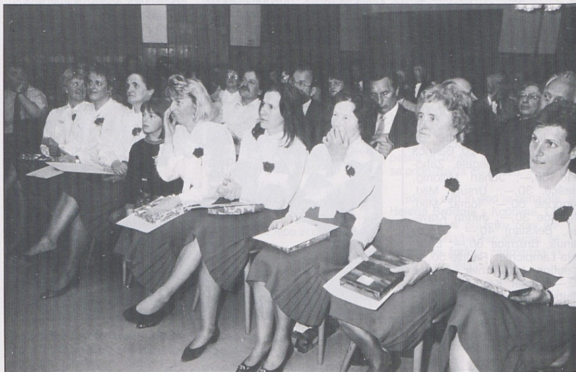
Prejšnjo soboto so pri Kovaču na Obirskem proslavili priljubljene obirske ambasadorke slovenske pesmi.

Predvsem pa je ponesel koroško slovensko pesem v Slovenijo. Človek bi rekel, da v naši sosednji državi skoraj ni dvorane, kjer ne bi zadonela