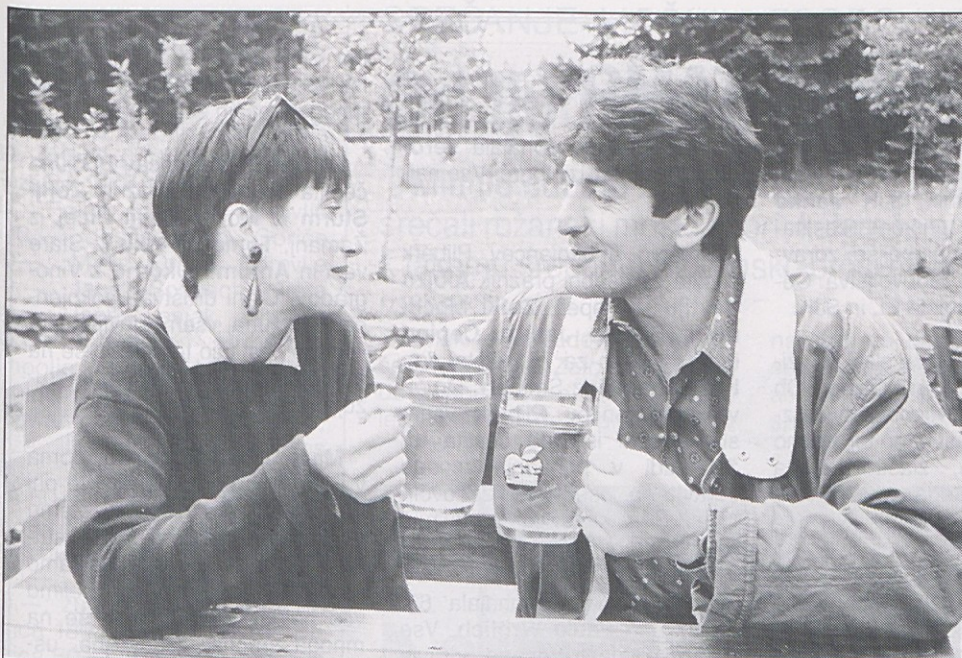
Kmečke točilnice (Buschenschenken) spet odpirajo. Prvič je izšla tudi brošura, v kateri so zbrane vse točilnice na Koroškem. Izdal jo je „Landesverband bäuerlicher Direktvermarkter“ in je lahko brezplačno naročite (tel. 0463 / 58 50 / 257). K sliki: mošt je eden izmed proizvodov, ki ga ponujajo v kmečkih točilnicah.