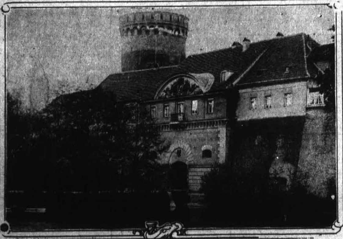
Slika predstavlja nemški "zakladni" stolp v Spandau, blizu Berolina. Tu so imeli Nemci že 40 let spravljene $60,000,000 v zlatu, katere porabijo za vojsko.

Francosko topništvo hiti na mejo. Kakor znano, imajo Francozi najbolj moderno topništvo. Francoska armada se ne zbira skupno na meji, pač pa se ustavlja v utrjenih mestih, katera morajo Nemci vzeti, če hočejo naprej.