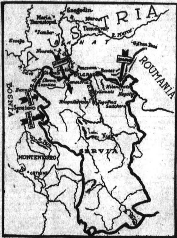
Mapa Srbije in dozdevno razvrščene srbskih in avstrijskih čet na avstro-srbski meji. Kakor znano, Avstrija nima sreče v vojni proti Srbom.

Od postanka Slovanske zgodovine pa do današnjega dne ni bilo resnejših in bolj osodepolnih časov za Slovanstvo, kot baš sedaj, ko se vrši pred našimi očmi velikanski boj slovanskega plemena za german-skim plemenom za obstoj in življenje. Tu gre za naš obstoj