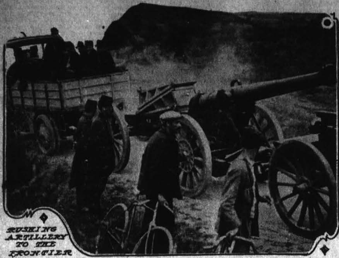
RUSKINS ARTILLERY TO THE FRONTIER

Francosko topništvo hiti na mejo. Kakor znano, imajo Francozi najbolj moderno topništvo. Francoska armada se ne zbira skupno na meji, pač pa se ustavlja v utrjenih mestih, katera morajo Nemci vzeti, če hočejo naprej.