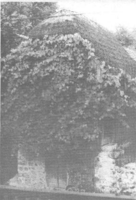
Stritarjeva kašča vse bolj propada