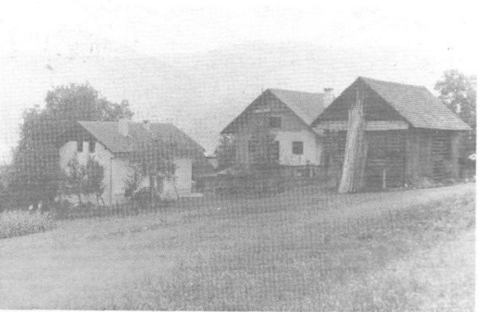
Podsmreška panorama: lepa narava, a še vedno slabe ceste