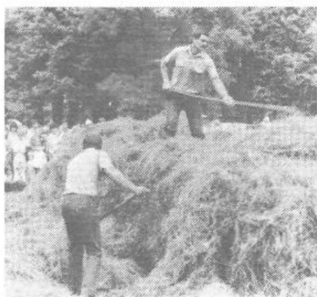
Nakladalci sena v boju s štoparico