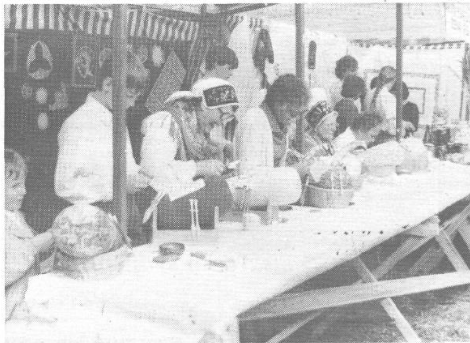
Čipkarska spretnost je že pravo narodno blago. Škoda je le, ker je še vedno premalo cenjena

V uradnem delu prireditve so se gostje zgrnili okrog okrašene slavnostne tribune, kjer je ob spretni vezni besedi Črta Kanonija urednica »Naše