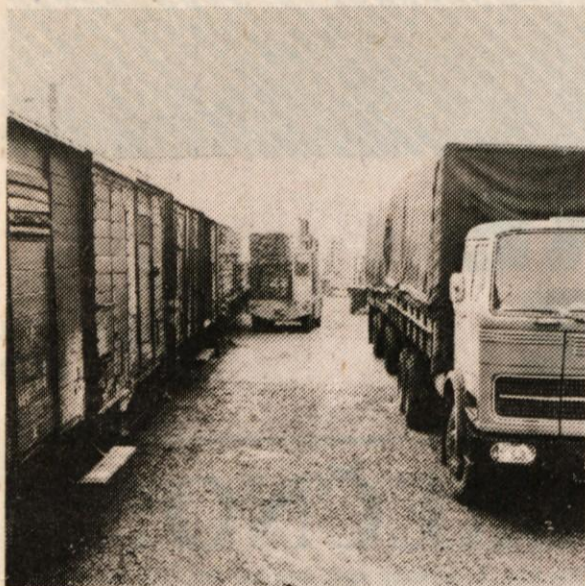
Vsak dan naložimo na tovorne vagonne naše izdelke, ki jih odpeljejo na tržišča po širšem svetu