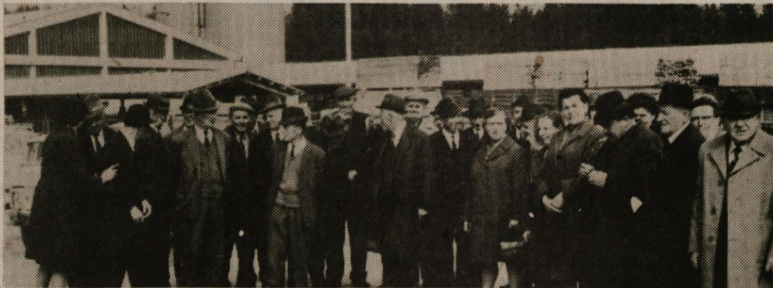
Tudi lani so obiskali KLI naši upokojenci in si ogledali proizvodnjo

Dohodki skupnosti pokojninskega in invalidskega zavarovanja v Sloveniji so se zbirali po 12,7-odstotni stopnji od bruto osebnih dohodkov. Ta izvorni priliv dosega le 90 % lanskim izdatkom, zato je razumljivo, da so za letošnje poslovanje potrebni čedalje večji krediti. V juniju 1973. leta si je morala skupnost izposoditi že 200 milijonov dinarjev ali dobri dve tretjini svoje mesečne izplačilne mase, tako da je julija prvič v svoji zgodovini poslovala ves mesec s tujimi izposojenimi sredstvi. Rešitev problema vidijo vsi poznavalci razmer v povečanju izvirnih dohodkov do meja, ki bi omogočila skupnosti pokojninskega in invalidskega zavarovanja, da bo poslovala brez izgub, dokler si ne obnovi rezerve na ravni 15 % letne porabe.