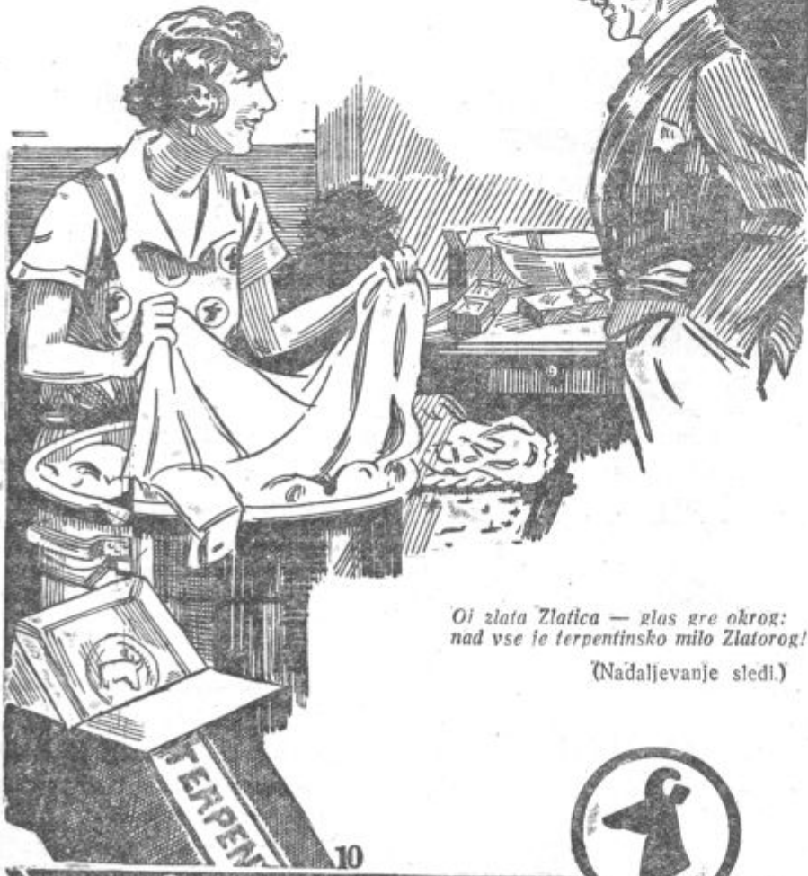
Oi zlata Zlatca — glas gre okrog: nad vse le terpentinsko milo Zlatorog!

Pri pranju ona žali se igrate razlaga ljubčka svojemu smehtlale: »Ves trud mi milo Zlatorog prihrani — živel boš srečno ti ob moji strani!«