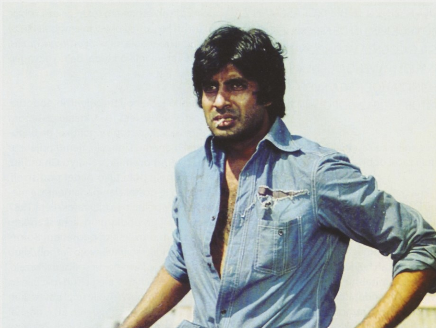
Bachchan v filmu Sholay

leta 1991 ga je na mini turneji v Južni Afriki na letališču pričakala takšna masa ljudi, da se je nekajminutna vožnja do hotela sprevrgla v 2-urno prebijanje mimo evforičnih oboževalcev, naslednji dan pa je v Durbanu razprodal koncert s 60.000 obiskovalci. In ko se je bogastvo nabiralo, ga je bilo potrebno nekam investirati. Bachchan je po igrilstvu, politiki in glasbi postal še poslovnež. Leta 1995 je ustanovil medijsko podjetje ABCL (Amitabh Bachchan Corporation Limited), ki se je na izjemno ambiciozen način lotilo vrste dejavnosti: filmske in glasbene produkcije, organizacije dogodkov, menedžmenta, iskanja talentov. Leta 1997 je podjetje organiziralo tekmovanje za miss sveta, ki so ga zaznamovali finančni škandali in protesti feminističnih skupin. Podjetje je leta 2000 bankrotiralo, novoustanovljeno podjetje A B Corp pa je nadaljevalo manj megalomansko, zgolj kot filmsko-produkcijska hiša.