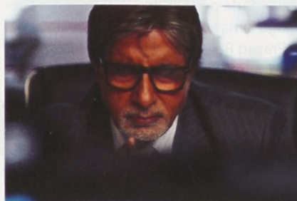
Bachchan v filmu Rann

Tudi na filmu je bilo zanj potrebno najti novo mesto. V 90. letih so producenti in