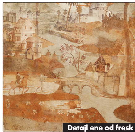
Detajl ene od fresk

ravno prav oddaljena od vrveža; imajo "odlično ponudbo doživetij in enogastronomije", "gostoljubno in romantično ozračje, imamo najboljša vina na svetu, imamo torej čisto vse". Vsak dogodek tukaj bo "edinstven"!