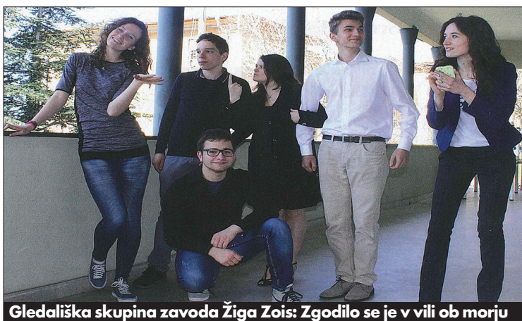
Gledališka skupina zavoda Žiga Zojs: Zgodilo se je v vili ob morju

stavraciji, kjer so se na večerji srečale štiri prijateljice iz otroških let, ki se že dolgo niso videle. Življenjska pot jih je zanesla v različne kraje. Ena izmed njih se je bolj odtujila, saj živi v Londonu