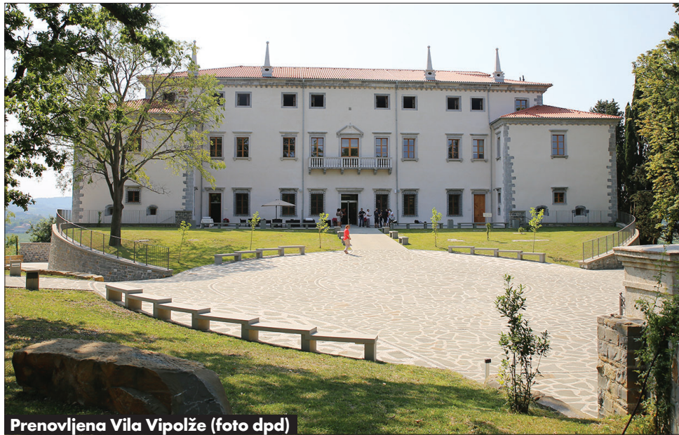
Prenovljena Vila Vipolže