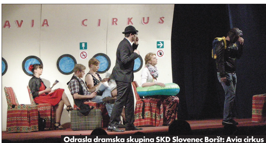
Odrasla dramska skupina SKD Slovenec Boršt: Avia cirkus

Sobota, 4. julija 2015 Predzadnji dan 11. Zamejskega festivala amaterskih dramskih skupin se je v vročem julijskem večeru - v vasi pod Grmado je sicer zmeraj bolj prijetno hladno - začel s komedijo Svakinja da te kap , ki jo je za skupino z Repentabra (KD Kraški dom in Razvojno združenje Repentabor) z lepim odnosom do vaške stvarnosti sestavila Anja Škabar in tudi režijsko - resnici na ljubo se je režija omejila le na prihode in odhode! - vodila osem nastopajočih. Ti so v predstavi, ki je imela značaj klasične ljudske igre, tudi z narečno obarvanostjo, v kateri se izražajo nekateri dramski liki, ustvarili pristno vaško ozračje. Središče življenja na vasi je seveda vaški trg in klopa ob vodnjaku, kjer so se v nek-