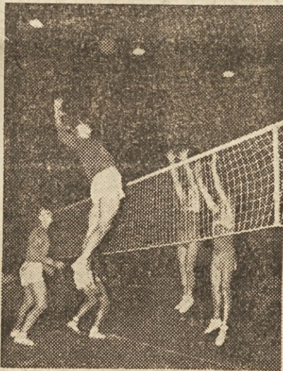
Posnetek s tekme CSR:SZ. Na sliki vidimo, kako visoko so se odprnili igralci ob mreži

V najlepši tekmi prvenstva med Rusi in Čehi sta se srečala dva sistema, ruski, skoraj brutalno ofenziven, in češki, mehak, z nenavadno obrambno tehniko in preciznostjo. Rusi so v prvem in drugem nizu igrali brez primere! Očividno je bilo, da so s to igro prekosili same sebe. Po drugem nizu niso več