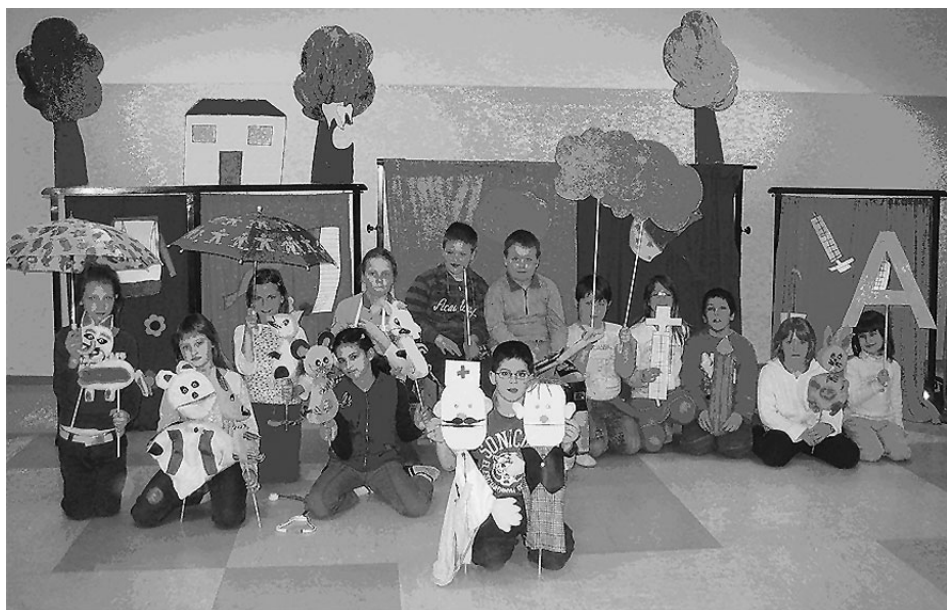
Slika 1: Nastopajoči igralci v lutkovni igrici

Opisan primer je nastal v OŠ Prežihovega Voranca na Ravnah na Koroškem v šolskem letu 2007/08, na področju interesnih dejavnosti med učitelji na razredni stopnji v povezanosti s še nekaterimi sodelavci na šoli in v okolici šole. Mentorice interesnih dejavnosti smo oblikovale skupno idejo, zastavile načrt in cilje, razdelile dela in naloge ter ob pomoči in sodelovanju še nekaterih članov tima ustvarile lutkovno oz. gledališko igrico z naslovom Rok in angina, s katero smo predstavljali šolo tudi na medobmočnem srečanju lutkovnih skupin v Dravogradu. Predstave so se vrstile v različnih ustanovah na Koroškem v okviru društva DPM in zavoda za kulturo, nastopili pa smo tudi v nekaterih koroških osnovnih šolah in vrtcih. V okviru lutkovnega krožka, ki je v zadnjem času začel delovati že na širšem nivoju ter prerasel v šolsko gledališko skupino, smo se odločili povabiti k sodelovanju še učiteljice ostalih razredov in mentorice drugih interesnih dejavnosti, druge delavce na šoli in zunaj šolskega okolja. Pojavila se je potreba (materialna, časovna, organizatorska ...) po sodelovanju z drugimi interesnimi dejavnostmi na šoli. Skupna razmišljanja smo učiteljice uresničile na učiteljski konferenci, ko smo predstavile pobudo vodstvu in vsem zaposlenim, nato pa smo na skupnih aktivih pripravile načrt dela in smernice za izvedbo ter sprotno uresničevanje in evalvacijo začrtanih ciljev.