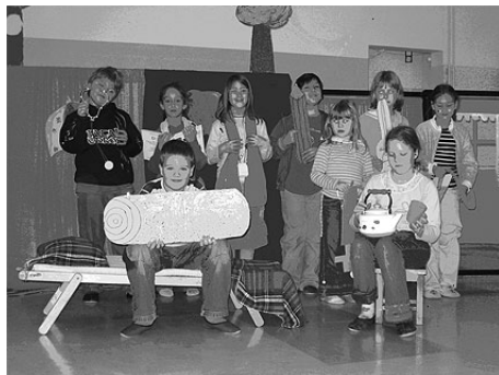
Slika 3: Skupina učencev s pripomočki za igrico

Pri lutkovnem krožku smo z učenci izdelali tri različne vrste lutk, knjižničarka je z učenci prebrala zgodbe in recitacije, obravnavala vsebino, nato so učenci izbirali med vlogami in se naučili vsebino po vlogah. Učenci pri likovnem krožku so oblikovali likovne izdelke, ki smo jih potrebovali kot pripomočke za igrico in sceno na paravanu.