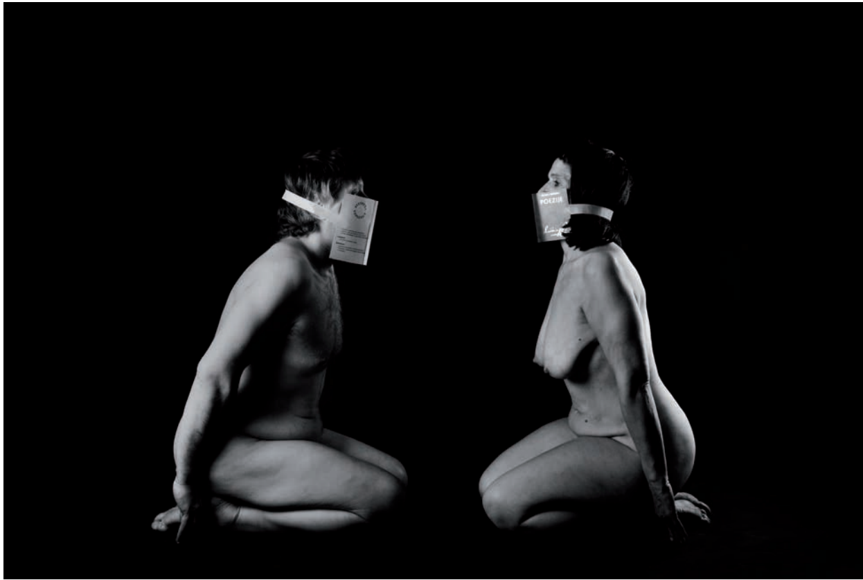
Dan knjige, 2020, čb-fotografija, 30 x 45 cm