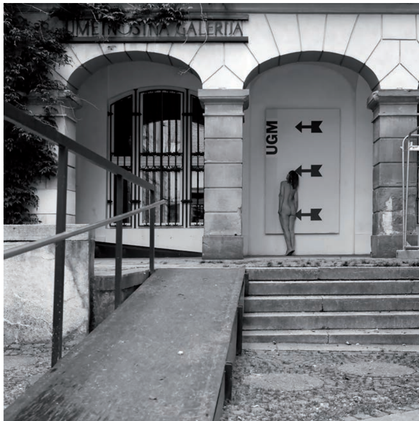
Zaprto, 2020, čb-fotografija, 45 x 45 cm