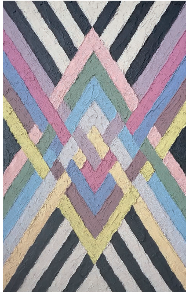
Črte 2, 2020, akril, mešane tehnike na platnu, 70,5 x 35 cm