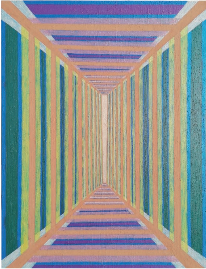
Barvni tunel, 2020, akril, mešane tehnike na platnu, 94,5 x 69,5 cm