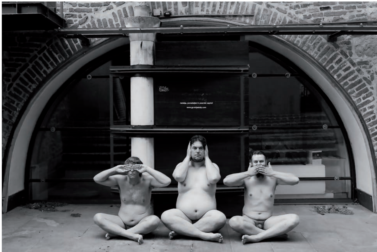
Mizaru Kikazaru Ivazaru, 2020, čb-fotografija, 40 x 60 cm