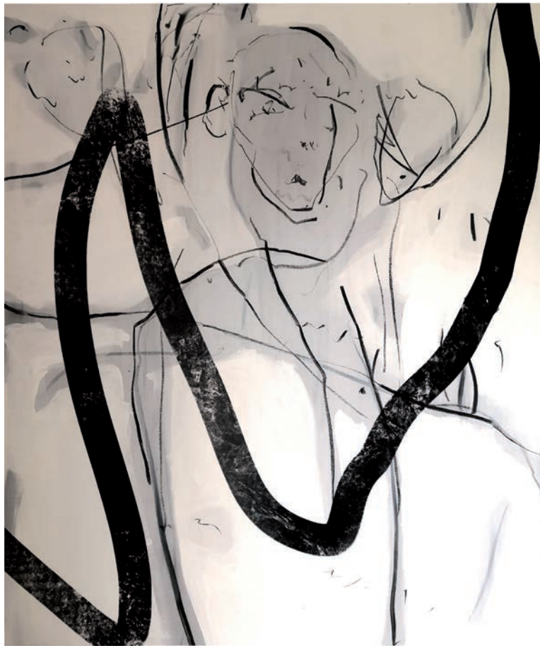
Svobode, 2020, oglje, akril na platnu, 150 x 150 cm