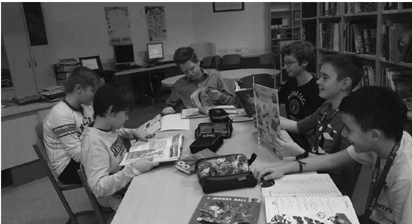
Slika 2: Listanje po knjigah, stvarno kazalo – kaj je že to?

kot dopolnitev in popestritev, pravilno navedena uporabljena literatura in napisani avtorji plakata). (Priloga 1)