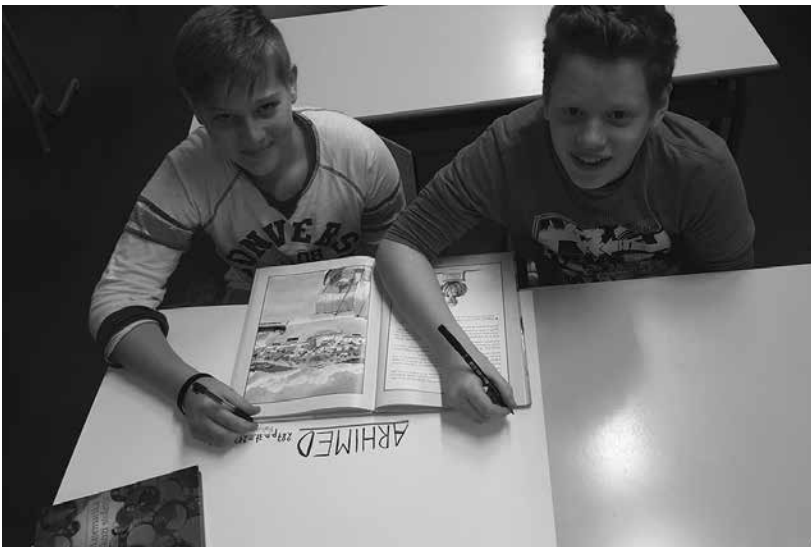
Slika 3: Naslov mora biti privlačen in viden.

Matematične delavnice imamo na urniku enkrat tedensko, zato je naše delo potekalo več tednov, učenci pa so tako imeli možnost dobro raziskati izbrano temo in razmisliti o vsebini in videzu plakata, ga ustrezno izdelati ter predstaviti sošolcem. Uspešno so povezali ukvarjanje z matematiko v zgodovini s svojim matematičnim znanjem. Odlično sodelovanje s knjižničarko je pripomoglo k samostojnemu iskanju in izboru gradiva ter njegovi uporabi pri oblikovanju plakata. Zdi se mi pomembno, da učenci v različnih učnih situacijah spoznajo, da morajo izbrano literaturo uporabljati kritično in pri izdelavi pisnih izdelkov spoštovati avtorske pravice ter natančno navesti vire. Medpredmetno povezovanje s knjižničnim informacijskim znanjem jim je ponovno ponudilo priložnost za to. ●