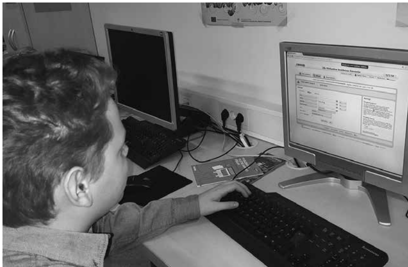
Slika 1: Iskanje gradiva v katalogu COBISS/OPAC naše šolske knjižnice

V uvodu sem učence vprašala, katere znane matematike že poznajo. Spomnili so se, da so