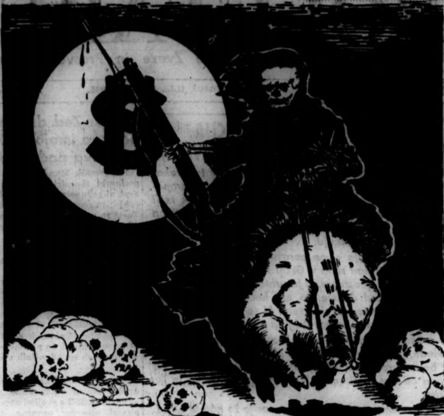
VOJNI MERJASEC, lobanje, vojni hujskač in znak zlatega teleta

Vendar pa je Dulles navzočim škofom in drugim predstavnikom metodistične cerkve naglašil, da svojega mnenja o sovjet-