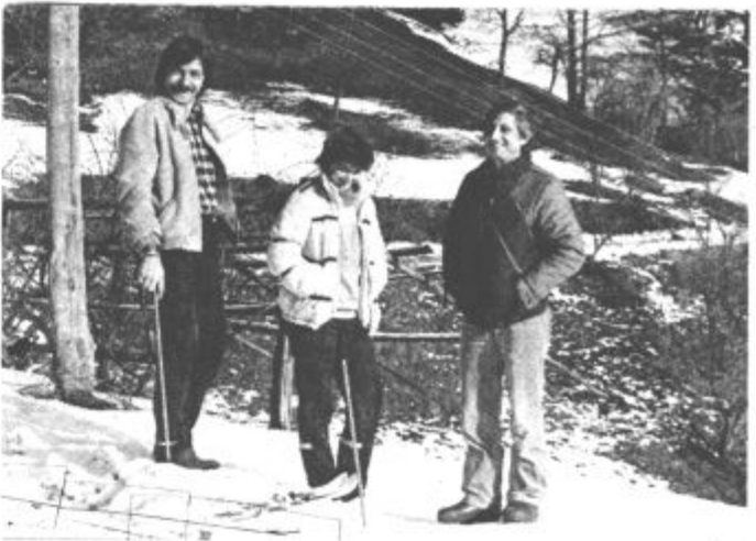
Mladi gospodar (levo) v pogovoru z gosti — teh je zaenkrat še malo.