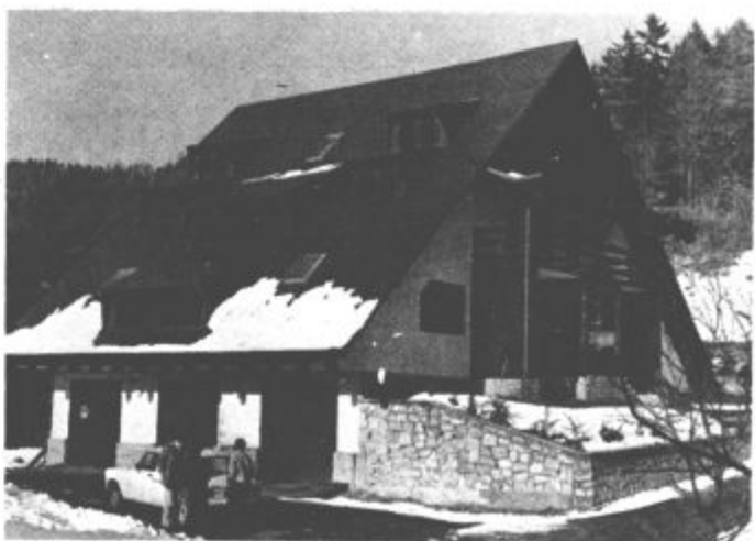
Objekt je lep in prijetno urejen. Postrežejo vam z domačimi jedmi.

razmišljali tudi o reklamah. To želijo nadoknaditi v prihodnjih mesecih, da ne bodo glavni del sezone, ki naj bi bil poleti, sobe ostajale prazne. Zares komforten penzion ob dobrih slovenskih narodnih jedeh velja le 750 din. Pri Vrabiču pa pripravijo tudi pogostitve za posebne priložnosti za zaključene družbe. Če želite popeljati svoje prijatelje na kmečki turizem pri Pirečniku gotovo ne boste razočarani.