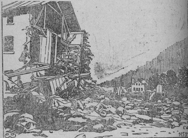
Die Zerstörungen im Isergebirge.

Poročali smo v zadnjih številkah o velikanski nesreči, ki se je zgodila v Iser-gorovju. Zatvorbo doline ob „weiße Desse“ je voda raztrgala. Vodovje je pretrgalo vse ovire, odneslo veliko število vasi, tvornic in delavnic ter zahtevalo tudi celo vrsto smrtnih žrtev. Prizadeta škoda znaša več milijonov kron. Naša slika kaže neko po razdivjani vodi uničeno vas. Izvršila so se seveda vsa potrebna varstvena dela, da se ta nesreča ne more ponoviti.