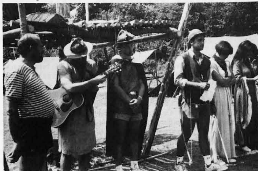
Robin Hood in Lady Marian v Sherwodskem gozdu

Poletje mineva. Z njim minevajo še zadnji brezskrbni počitniški dnevi in že se porajajo prvi spomini na komaj minule počitnice. Poletne dneve preživlja vsak drugače; ta na morju, oni v gorah, skavt pa poleti preživi dva tedna pod šotori, v naravi, daleč od mestnega hrupa.