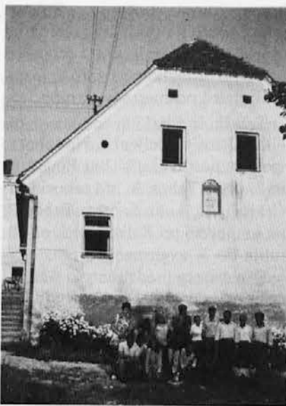
Doberdobska mladina pred rojstno hišo škofa A.M. Slomška

Znano je, da je severna meja Slomškove škofije tekla po črti, ki je tedaj veljala za narodno mejo med Slovenci in Nemci na Štajerskem - seveda po nemški razlagi in gledanju. Nova, lavantinsko-mariborska škofija je to mejo s slovensko pastoralo tako utrdila, da je bila čez šest desetletij Slovincem samoumevna in so nemške zahteve po vsem Podravju izzvenele v prazno. S to mejo smo Slovenci dokončno dobili svojo severno mejo, Prekmurju pa se je pozneje odprla pot v matično Slovenijo.