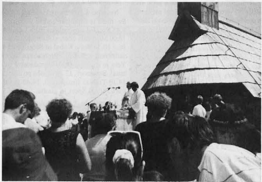
Zlatomašno slavlje pred kapelico Marije Snežne na Veliki planini med planšarji

Kot svatje smo bazovski verniki in tržaški prijatelji spremljali msgr. Živica na zlatomašno slavlje na bleščečo kamniško planoto.