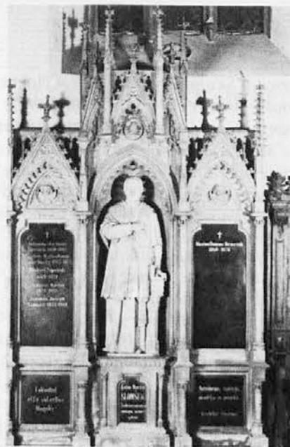
Slomškov kip v mariborski stolnici

Zveza slovenske katoliške prosvete iz Gorice vabi zbere, ki nameravajo na Cecilijanki sodelovati, da sporočijo program treh pesmi do 31. oktobra.