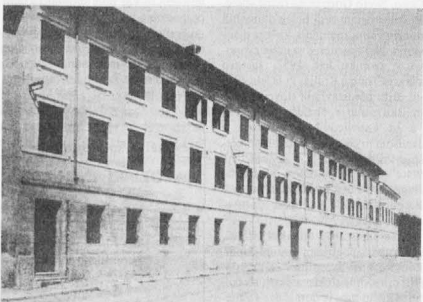
Nekdanje poslopje Alojzijevešča v Gorici, ki so ga podrli 1988. leta

»Vsi smo bili prepričani, da bodo imela nadškofova prizadevanja pri novi italijanski vladi in zlasti pri resnem državniku Alcideju De Gaspe-