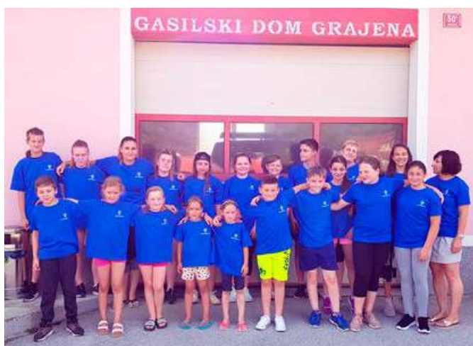
Majice za PGD Grajena