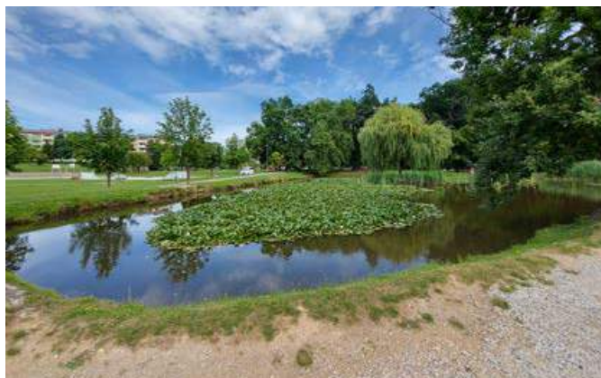
Pristopili bomo k urejanju ribnika v Ljudskem vrtu.

Mestna občina Ptuj je naročila projektno dokumentacijo za protipoplavne ukrepe na območju Mestne občine Ptuj na lokacijah Grajena (zadrževalnik Grajena), Rogoznica (zadrževalnik Rogoznica), Vičava (ČS Panorama), Ljudski vrt (zadrževalnik) in Čreta. Veseli nas, da je prišlo do prenosa zemljišča, saj bomo lahko končno pristopili k urejanju ribnika v Ljudskem vrtu . Območje Ljudskega vrta bomo tako lahko postopoma tudi vsebinsko in infrastrukturno nadgradili.