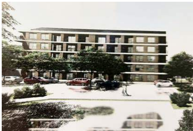
Vizualizacija bloka za neprofitna stanovanja (fotografija je simbolična).

Številne napore vlagamo tudi v aktivnosti za izgradnjo oskrbovanih stanovanj. Prizadevamo si za 30 novih oskrbovanih stanovanj na lokaciji Potrčeva cesta, ob marketu Živila.