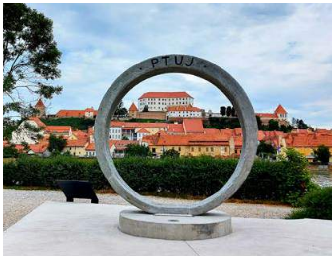
Darilo mestu ob 1950-letnici prve pisne omembe Ptuja v antičnih virih

Po neurju smo skupaj z donatorji zasadili nova drevesa, načrtujemo jih še več. Uredili smo ekološki otok ob Ranci ter postavili klopi in koše ob poti iz mestnega parka do Rance, dodatno ozelenjujemo mestno jedro z drevesi in zasaditvami v loncih, namestili smo dodatne koše za smeti, postavili označevalne table, v prazničnem decembrskem času smo poskrbeli za novoletno okrasitev in smrečice, ki so pričarale praznično vzdušje, posadili smo drevesa v parku Turnišče, poskrbeli, da na gradu plapola zastava, skupaj s partnerji projekta postavili turistični okvir pred ptujskim pešmostom.