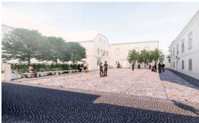
Vizualizacija prenovljenega Vrazovega trga (pogled iz Jadranske ulice)