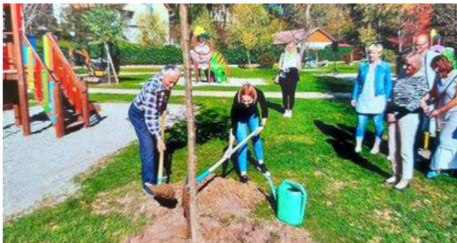
Dodatno ozelenjujemo mesto z drevesi in zasaditvami v loncih.

Znotraj vzpostavitve urbanih vrtov na Mlinski cesti smo trenutno v fazi nadaljevanja priprave vrtov. Uredili bomo poti in vodovod. Hkrati z urejanjem na terenu se pripravljajo javno zbiranje ponudb za oddajo vrtov v najem. Na lokaciji je predvidenih 50 vrtov, najemnina je ovrednotena na 0,34 EUR/m 2 /leto. Vrtovi, ki bodo ponujeni v najem zainteresiranim uporabnikom, bodo v velikosti 50 m 2 in 25 m 2 .