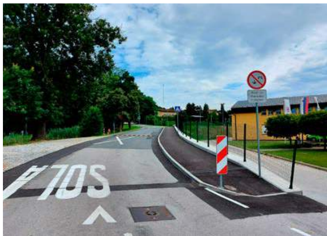
Pločnik v Ljudskem vrtu

Letos smo uredili cesto Žabjak–odcep Kores v ČS Rogoznica,