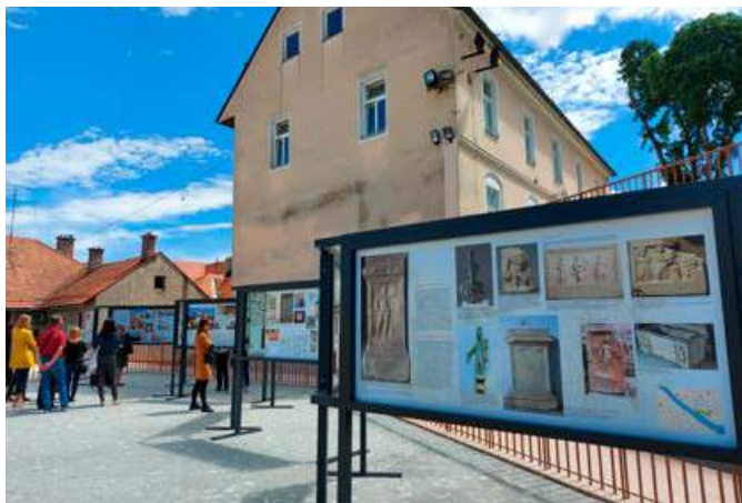
Razstava na prostem Številne podobe Ptuja je prenovljeni mestni tržnici dodala novo vsebino in ponudila vpogled v že pozabljene podobe mesta.

kupili mali oder, projektu letos dokončane prenovljene mestne tržnice pa vnesli dodatno vsebino z razstavo na prostem Številne podobe Ptuja.