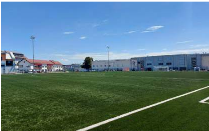
Prenovljeno igrišče z umetno travo

kupili mali oder, projektu letos dokončane prenovljene mestne tržnice pa vnesli dodatno vsebino z razstavo na prostem Številne podobe Ptuja.