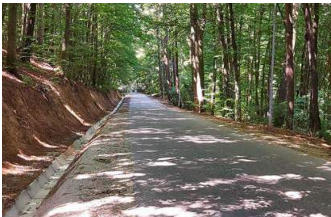
Položene kanalete na grajenem bregu

Po 15 letih smo uredili meteorno kanalizacijo s položitvijo betonskih kanalet v grajenski breg . Tudi v ČS Spuhlja se je izvedlo čiščenje odvodnega jarka v dolžini 600 m, s čimer smo izboljšali poplavno varnost v naselju Spuhlja.