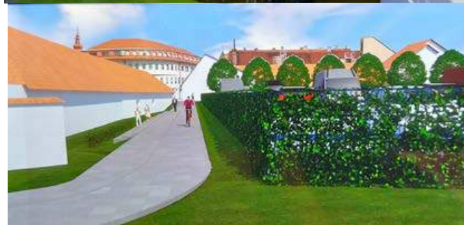
Vizualizacija garažnega platoja

Zavedamo se, da je v našem mestu veliko izzivov, veliko je tega, kar je še treba postoriti. Zato pripravljamo ново razvojno strategijo , ki bo temeljila na realnih možnostih izvedbe posameznih projektov, ki jih bomo skupaj identificirali, finančno ovrednotili in terminsko umestili.