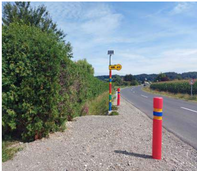
Stojišča za večjo varnost šoloobveznih otrok

Zavedamo se, da so številne šolske poti še vedno nevarne, pri čemer je treba poudariti, da smo na teh odsekih odvisni od državnih načrtov urejanja cest. Kljub temu da se urejanje državnih cest ne odvija, smo zadovoljni, da nam je skupaj z DRSI uspelo urediti stojišča na Slovenskogoriški cesti , s čimer smo zagotovili večjo varnost otrok, ki na tem mestu vstopajo na avtobuse.