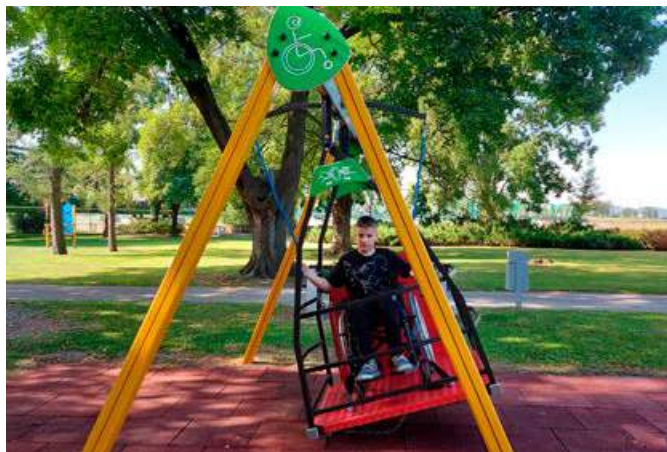
Gugalnica v mestnem parku že služi svojemu namenu.

čju Ljudskega vrta in mestnega parka smo postavili igrala, ki so namenjena invalidom na invalidskih vozičkih .