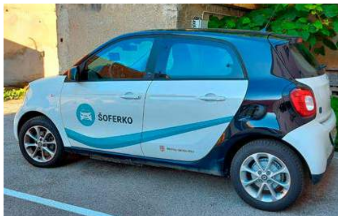
Šoferko je do konca junija po opravkih odpeljal več kot 200 starejših.

Izjemno ponosni smo na projekt Šoferko , kjer smo moči združili z Javnimi službami Ptuj in ZŠAM Ptuj ter tako poskrbeli za brezplačne prevoze starejših in drugih občanov. Prevozi so