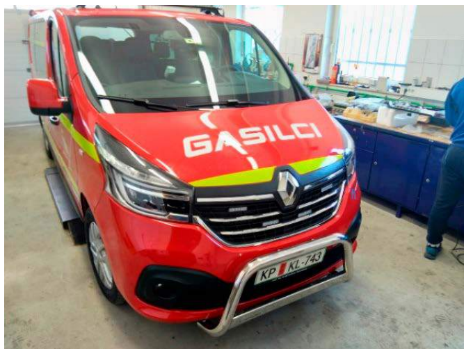
PGD Sp. Velovlek je dobilo vozilo za prevoz moštva.

Zastavili smo si načrt dobave gasilske opreme, s katerim želimo zagotoviti pogoje za uspešno opravljanje gasilske službe. V naslednjih letih bomo posodabljali vozni park prostovoljnih gasilskih društev in gasilsko infrastrukturo (Gasilski dom Pacinje). PGD Sp. Velovlek je po 25 letih dobilo vozilo GVM – gasilsko vozilo za prevoz moštva. Ob letošnji 150-letnici PGD Ptuj bo društvo bogatejše za novo vozilo – cisterno, PGD Turnišče pa ob 40. obletnici za gasilsko prikolico. Mladincem in pionirjem smo za spodbudo in za dobro delo v prostovoljnih društvih podarili majice.