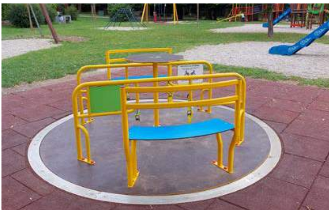
Vrtljak in gugalnica v Ljudskem vrtu

Trudimo se poskrbeti za vse starostne skupine. Otroke smo odpeljali na izlet v Vulkanijo, letos nam je načrte žal prekržila epidemija. Za otroke 1. triade smo organizirali brezplačno poletno počitniško varstvo. Ranljivejše skupine so tiste, kjer se reševanja problematike lotevamo še posebno tankočutno, saj se zavedamo njihovega položaja in potreb, ki jih imajo. Na obmo-