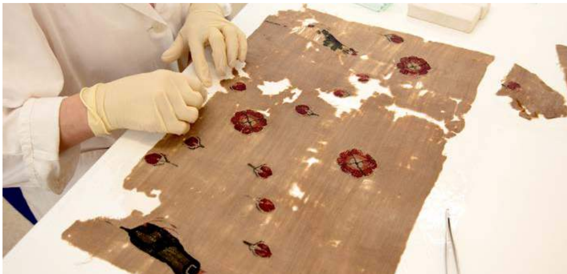
Konserviranje koptske tkanine v konservatorsko-restavratorski delavnici PMPO