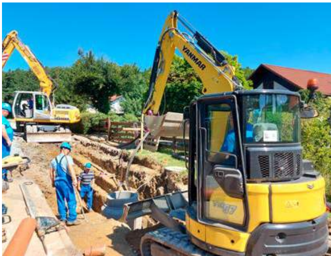
Na kanalizacijsko omrežje bo priključenih 32 hišnih številk.