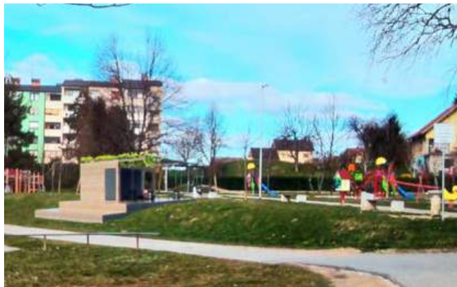
V Ljudskem vrtu bomo omogočili tudi postavitev enostavnega objekta za ponudbo napitkov in z javnimi sanitarijami.

V sklopu prizadevanj za umestitev javnih sanitarij na najbolj frekventne in problematične lokacije smo določili štiri lokacije – avtobusna postaja, mestni park, Ljudski vrt in parkirišče pod gradom. Lokacije, ki so zanimive s turističnega vidika, pa smo nadgradili z idejo postavitve enostavnih gostinskih objektov po zgledu že obstoječega na Ranci. Začeli smo pridobivanje potrebne dokumentacije. Postavitev bo zasnovana v obliki javno-