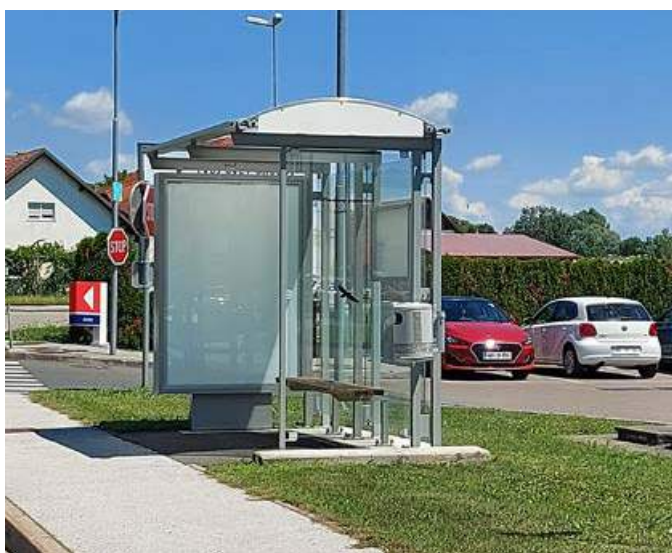
Avtobusne nadstrešnice na Zagrebški cesti

Uredili smo površine za pešce in kolesarje, posadili drevesa in živo mejo, sledi pa še postavitve klopi in košev za smeti.