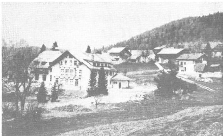
Rakitna – del vasi z zgradbami klimatskega zdravilišča