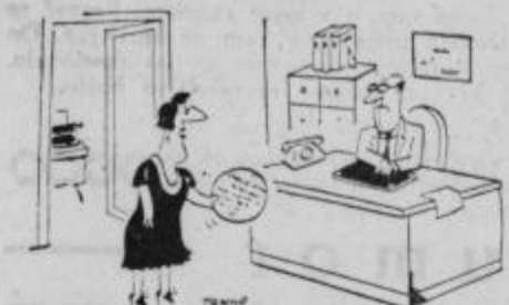
»Napisala sem vam okrožnico, kot ste rekli!«

Vsak davčni zavezanec prejme štirikrat letno položnico o višini predpisane akontacije za določeno tromesečje. Dostava vsake položnice je zvezana s stroški 50 din; torej 200 din letno. Zaradi lažjega obračuna se ti stroški predpisujejo dvakrat letno: to je pri drugi in četrti akontaciji po 100 din. Če pa ima nekdo že plačano akontacijo, odpade pošiljanje položnice in s tem tudi stroški.