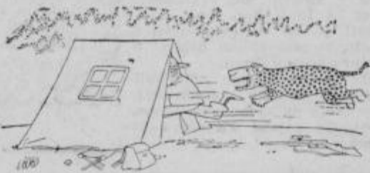
»Draga žena, prinesel sem ti krzno!«