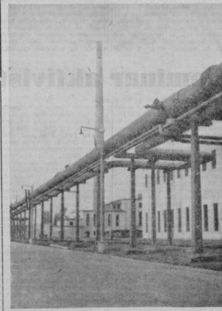
Tovarna glinice in aluminija