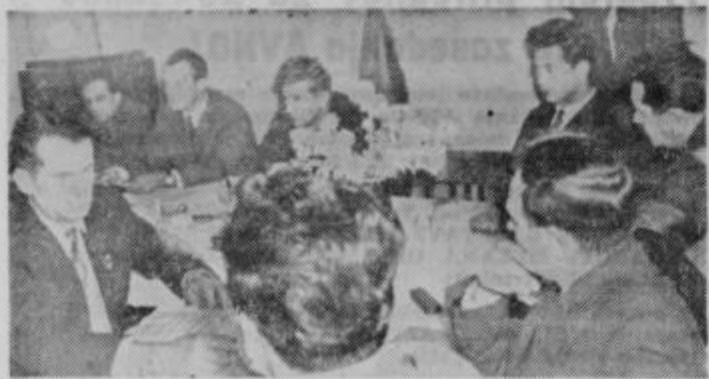
Udeleženci seminarja v prostorih grajske restavracije