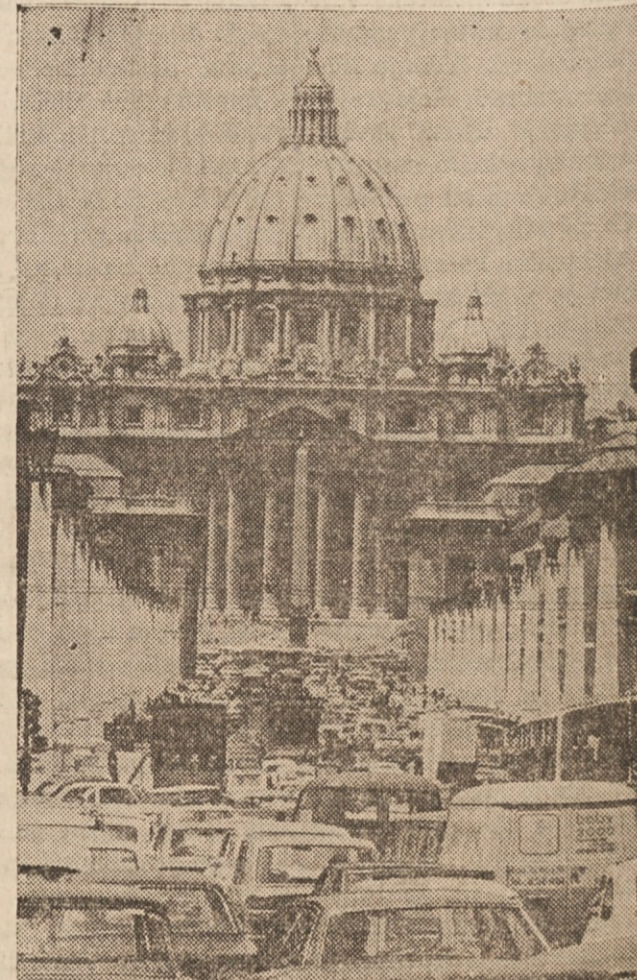
NE NA LEVO IN NE NA DESNO! — Ko so imeli v Rimu v Italiji nedavno štrajk javnih prevoznih sredstev, so bile ceste zatrpane z avtomobili v taki meri, da ni bilo mogoče voziti. Promet je od časa do časa popolnoma zastal tudi na Via Della Conciliazione, ki se odpira na trg sv. Petra.