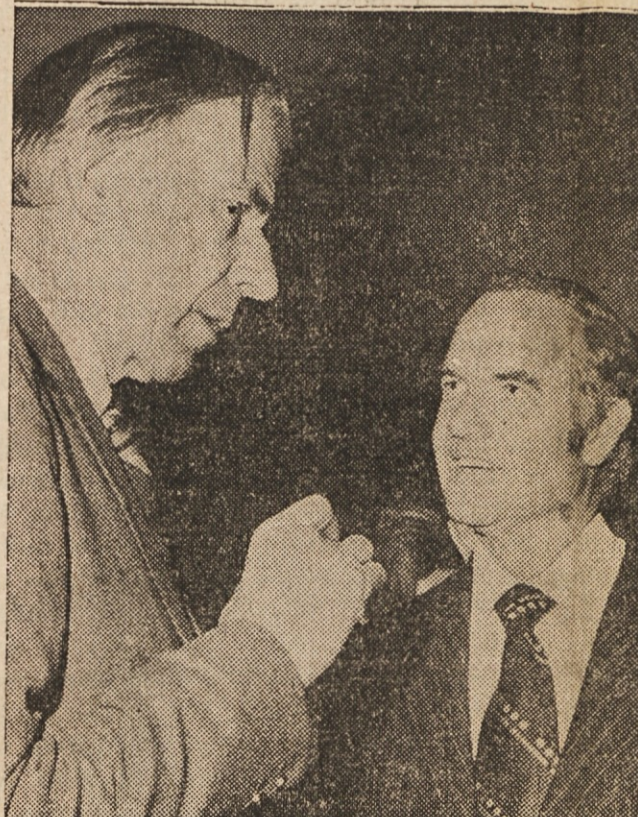
GOSPODARSTVO — K. Galbraith in McGovern se verjetno pogovarjata o gospodarskih vprašanjih, ko se McGovern pripravlja na predsedniško volivno borbo. K. Galbraith je glavni McGovernov gospodarski svetovalec.

razpravljali vodniki organiziranega delavstva.