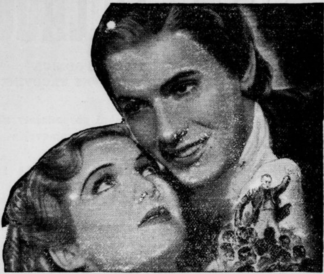
Prizor iz filma »Lord Nelson«, kjer imajo glavne vloge sami dobri igralci: Madeleine Carroll, Tyrone Power, Freddie Bartholomew in Sir Guy Standing