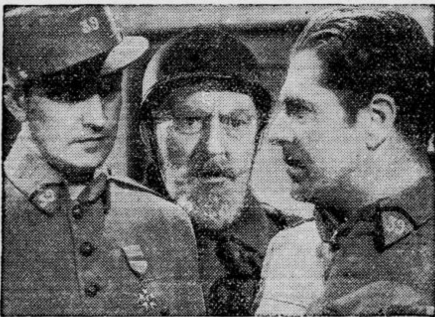
Trije zvezdniki na eni sliki! Fredric March, Lionel Barrymore in Warner Baxter v vojni drami »Parada smrti«

Stoletja že deluje CMD, karujemo še za pol stoletja!