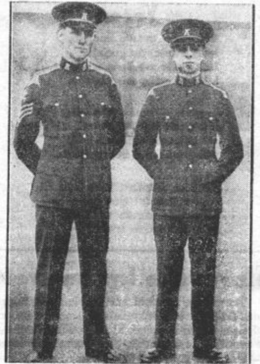
Nova uniforma angleške armade

Bolgarski kralj Boris je podpisal na predstoječe božične praznike ukaz, s katerim se delno, nekaterim pa v celoti odpušča zaporna kazen. Amnestiranih je nad 400 obsojencev, ki so bili obsojeni od civilnega, nekateri pa tudi od vojaškega sodišča.