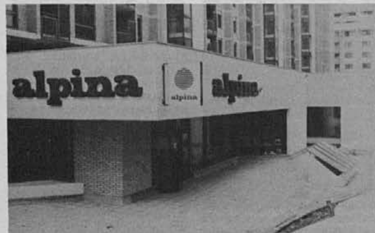
Zunanost nove prodajalne v Sarajevu