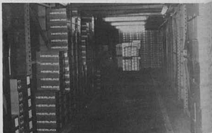
Takole je zatrpno skladišče končnih izdelkov