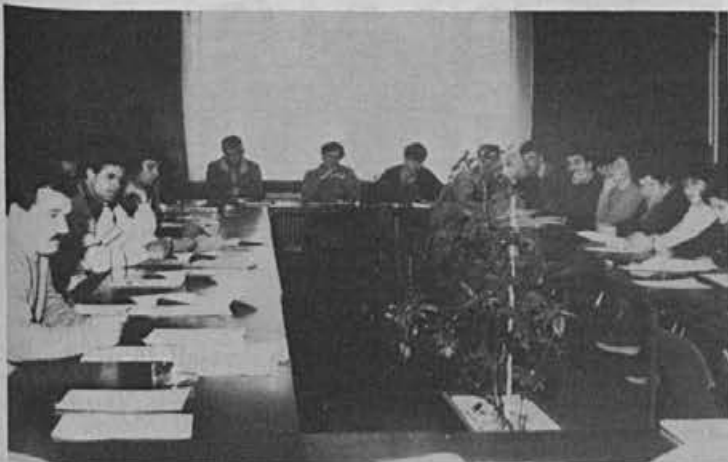
Seminar za vrednostno analizo je šele začetek za novo prakso