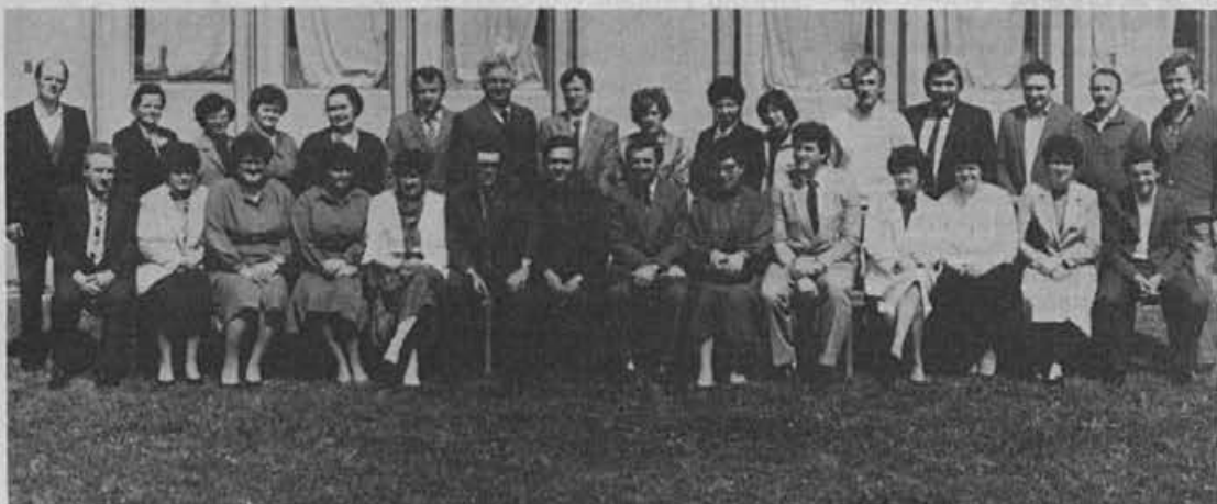
Jubilarji z 20 let delovne dobe

Prav tu pa imajo starejši delavci lahko pomembno