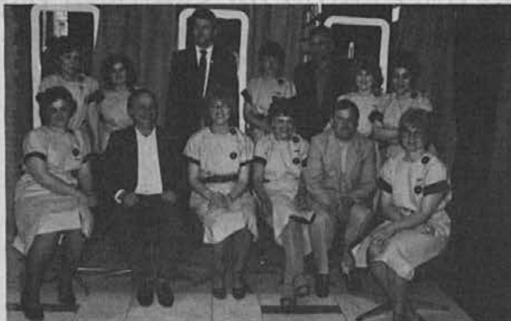
Kolektiv prodajalne Beograd I.

Lahko povem, da smo prostore za začasno skladiščenje iskali po vseh Žireh in okolici. Končno so se dogovorili, da bomo vzeli v najem Županov hlev, kjer bomo lahko začasno vskladiščili obutev na 200 m 2 . Upam, da bo s tem ta težava za silo rešena.«