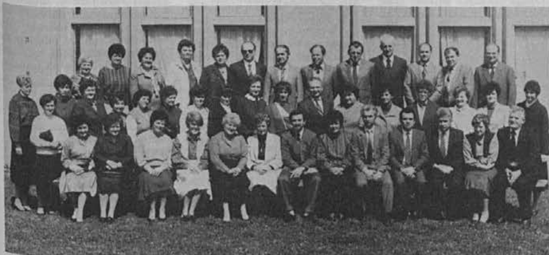
Jubilanti s 30 let delovne dobe