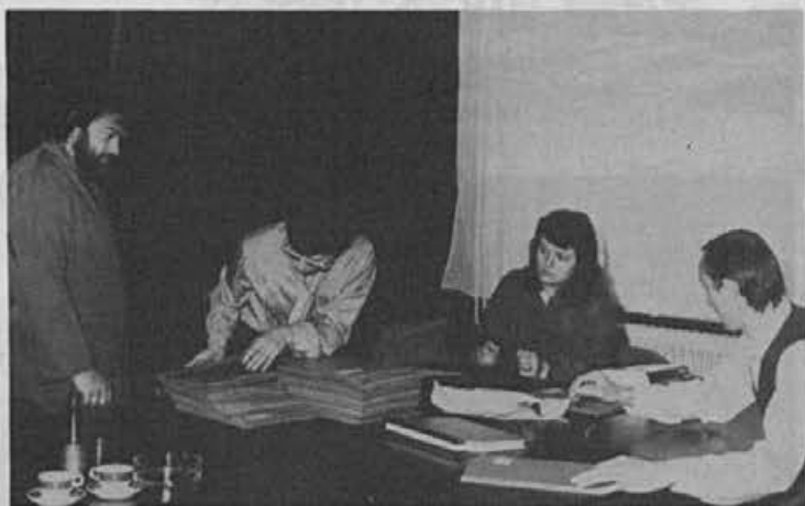
Naši delavci sklepajo pogodbe za najem kredita za stanovanjsko gradnjo