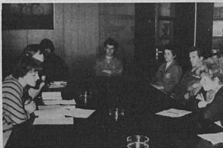
Delegacije so pričele z delom. Na sliki zasedanje skupne združene delegacije za zaposlovanje, izobraževanje in raziskovanje.

Tako so se v naši delovni organizaciji sestale in konstituirale že vse delegacije.