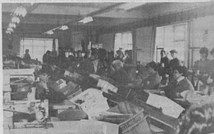
Cilj vseh teh investicij je torej zagotoviti osnovne pogoje za delo sedaj zaposlenih.

In tretje: znotraj samoupravne delovne skupine morajo delegati vseh delavskih svetov, pa tudi drugih delegacij in komisij in predstavniki družbenopolitičnih organizacij, ki so v tej skupini, tvoriti (oblikovati) samoupravno družbeno jedro, ki bo organiziralo razprave. Tako delegat ne bo več osamljen.