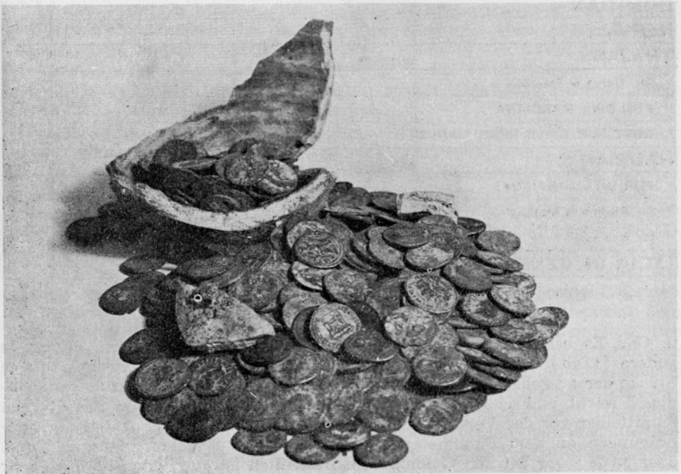
Abb. 1. Erla, N. Ö. Münzschatzfund

Der Münzfund kam zur Bearbeitung an das Münzkabinett in Wien, wo sich die Zentralstelle des Bundesdenkmalamtes für Münzfunde befindet. Nach der Reinigung des Fundmaterials begann die Bestimmung der Münzen und die Auswertung des Fundes. Das Fundmaterial reicht von etwa 40 v. Chr. bis 138